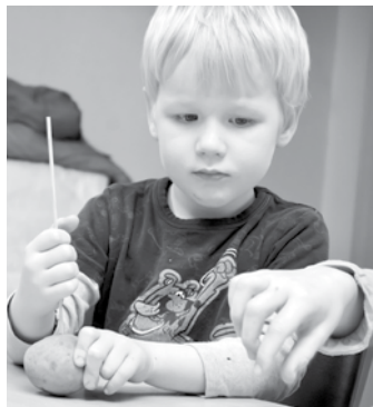
Ivars ar ko asu izveido caurumus, kuros iespraudīs spalvas.