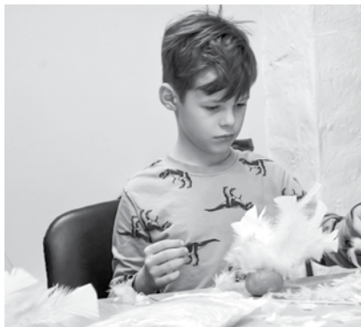
Kurts kartupeli bagātīgi izrotājis ar dzeltenām un rozā spalvām.