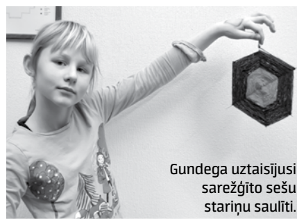
Gundega uztaisījusi sarežģīto sešu stariņu saulīti.

Izsenis, gaidot ziemas saulgriežus, latvieši mājas pušķojuši. Gadalaikā, kad saulītes vismazāk un nakts visgarākā, cilvēki darinājuši rotājumus, kas atgādina sauli.