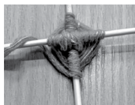
Karkasam paredzētos kociņus vai salmus liek krusteniski. Populārākais ir četrstūru un sešstūru ķīsts.