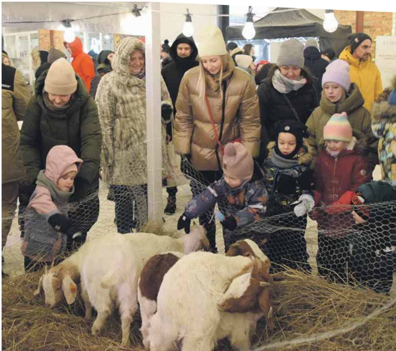
Kaļķu ielas kvartāla Ziemassvētku tirdziņā Kuldīgā daudzi gribēja draudzēties ar kazinām no Snēpeles saimniecības Strauss un kaza. Bērni tās buzināja, līdzcietīgākie centās apsegt ar salmiem, lai nav auksti.

Piektdien un sestdien Kuldīgā iegādāties amatnieku, mājražotāju un jauno uzņēmumu darinājumus, nogaršot vietējos gardumus varēja Kaļķu ielas kvartāla Ziemassvētku tirdziņā. Par spīti aukstumam interesentu netrūka, jo bija arī kultūras programma, mazajiem – darbnīcas un cita izklaide.