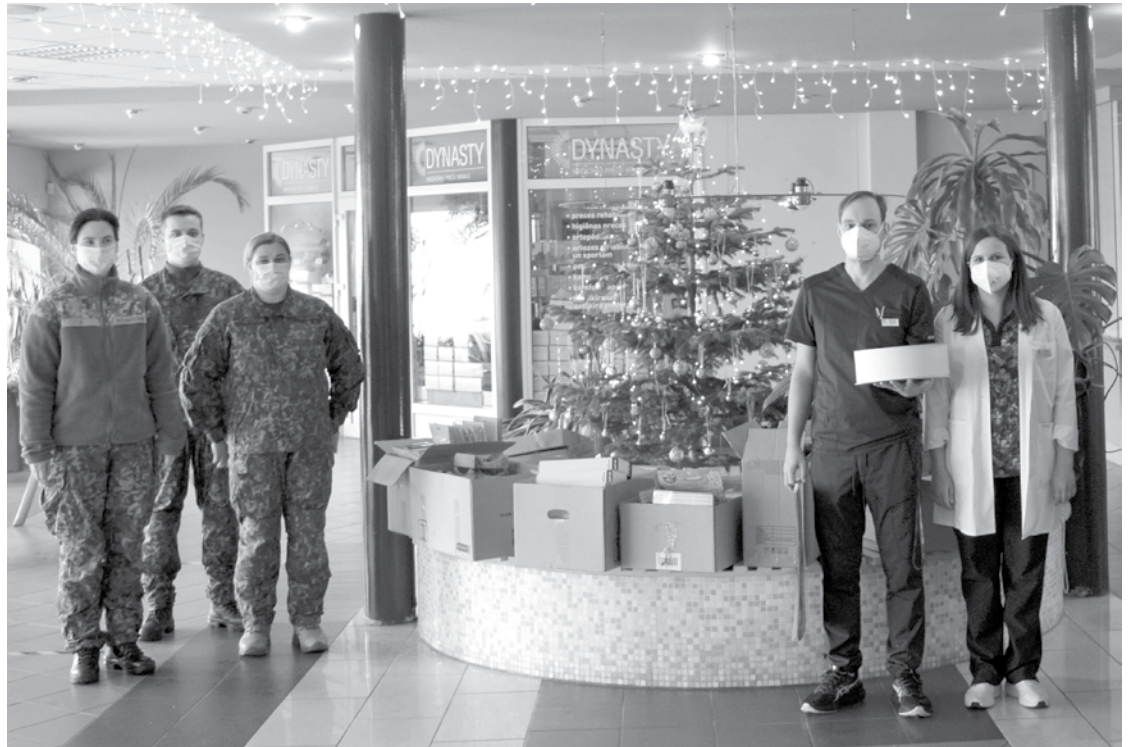
Kuldīgas slimnīcā zemessargi nogādāja aptuveni desmit kastes ar rotaļlietām, krāsošanas piederumiem un citām lietām, kas palīdz mazajiem pacientiem pavadīt brīvo laiku.