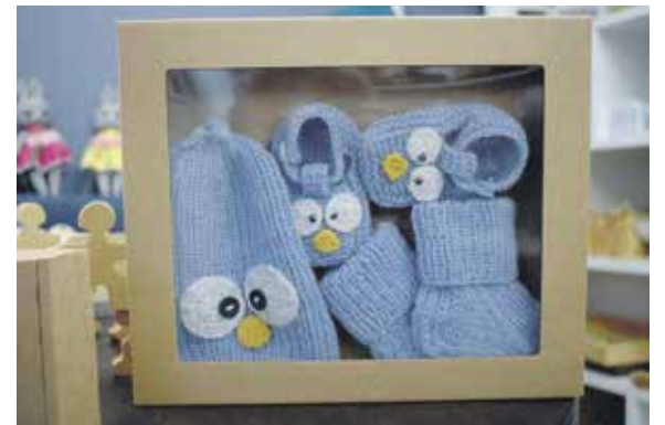
Kopš vasaras Akcentā ir Kuldīgā tapuši adījumi mazuļiem.