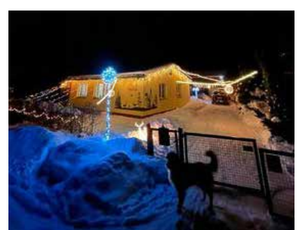
Kables Selgas. Iesūtījis Raimonds Goža.