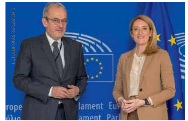
ROBERTS ZĪLE UN EIROPAS PARLAMENTA PRIEKŠSĒDĒTĀJA ROBERTA METSOLA

Klasisks instruments, ko inflācijas mazināšanai pie-