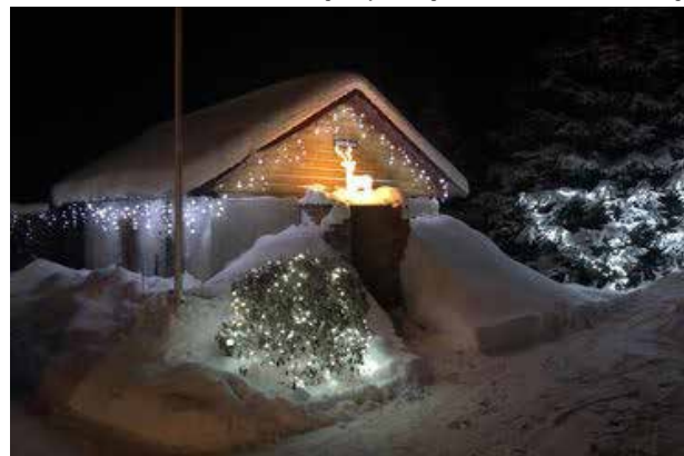
Gunitas Kudrovskas māja – Īvandes pagasta Krimas. Lai gaišais vairo gaišo!