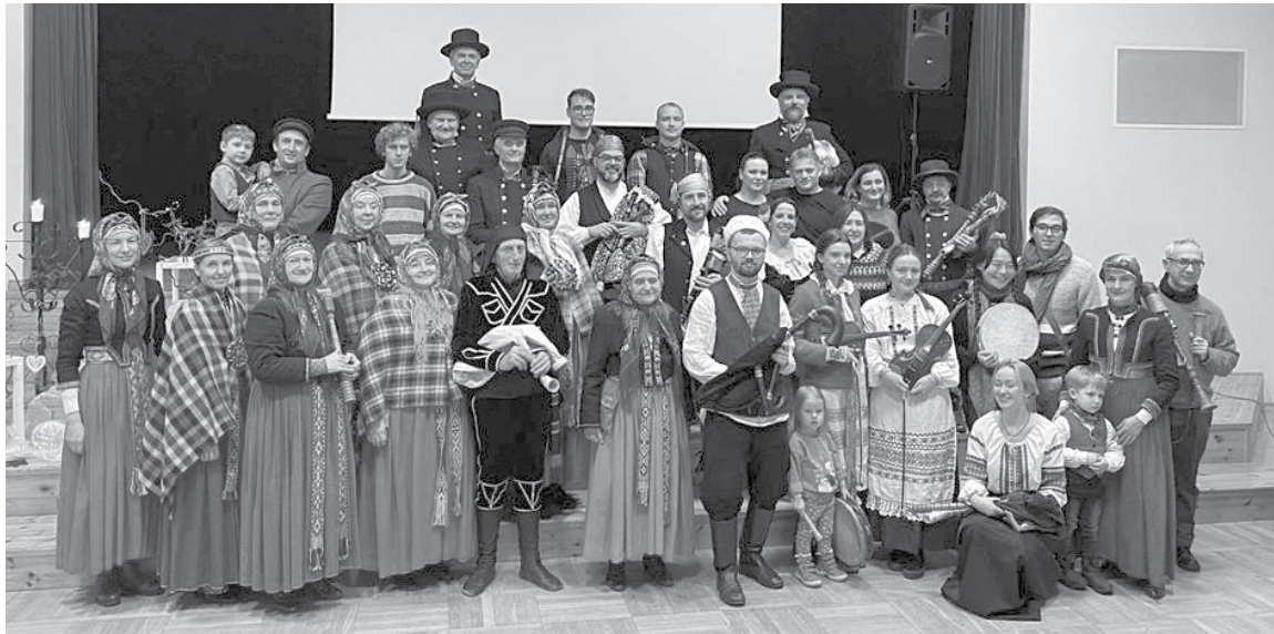
Alsungas folkloras ansambļi Suitu sievas , Suitu vīri un Suitu dūdenieki kopā ar Itālijas, Horvātijas, Gruzijas, Slovākijas, Spānijas un Baltkrievijas dūdienieku grupām Alsungas kultūras namā.

Pagājušās nedēļas nogalē Alsungas kultūras namā folkloras kopa Suitu dūdenieki saspēlējās ar dūdienieku grupām no sešām valstīm: Horvātijas, Itālijas, Gruzijas, Slovākijas, Spānijas un Baltkrievijas.