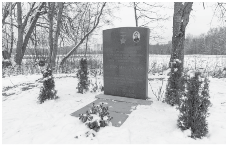
Piemīņas plāksne padomju karavīram Pēterim Kuprijanovam Nīkrācē atrodas plāvā netālu no Lidumnieku mājām un tagad tiks noņemta.

Oktoobrī domes deputāti nolēma pavisam demontēt 15 padomju