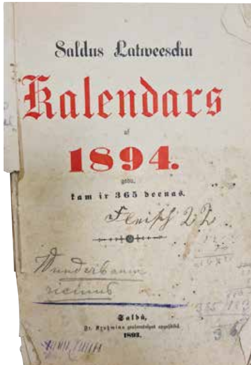
Pirmais saldenieku kalendārs. Friča Krūmiņa izdevums pielīdzināms vietējo veikalu skatlogiem un pakalpojumu katalogam, jo trešo daļu kalendāra aizņem reklāmas.

S. Leitholde mūs rosināja ar kritisku aci pārskatīt izdevumus no muzeja krājuma un pašiem pārliecināties, cik precīzi tie atspoguļo sava laika domas un runas. Piemēram, “Laika zoba kalendārs