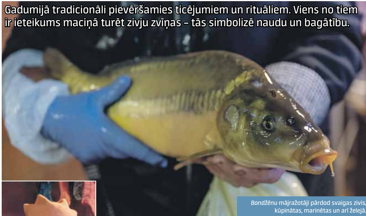
Bandžēnu mājražotāji pārdod svaigas zivis, kūpinātas, marinētas un arī želejā.

Gadumijā tradicionāli pievēršamies ticējumiem un rituāliem. Viens no tiem ir ieteikums maciņā turēt zivju zvīņas – tās simbolizē naudu un bagātību.