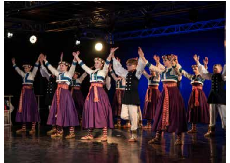
5.–7. klases grupa deļo Kalējiņus .