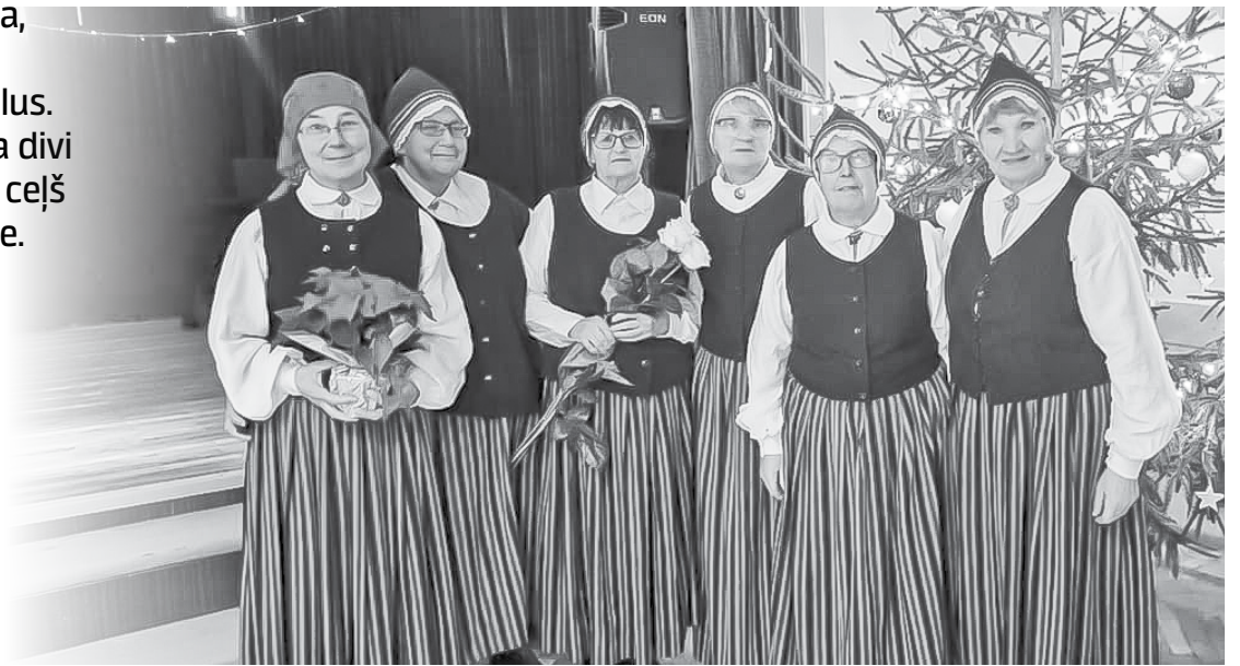
Kamenīte Ziemassvētku koncertā Rudbāržos.

Pirms Ziemassvētkiem paziņoti Latvijas folkloras un etnogrāfisko ansambļu skates rezultāti, un Ka-