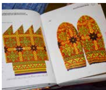
Grāmatā iekļauti 234 cimdu pāri.