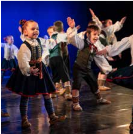
Sešgadnieki un pirmklasnieki deļā Dziesmiņa par zvēriņiem .