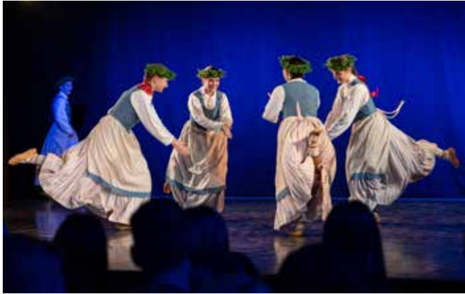
Venta deļā Čičā gotiņa.