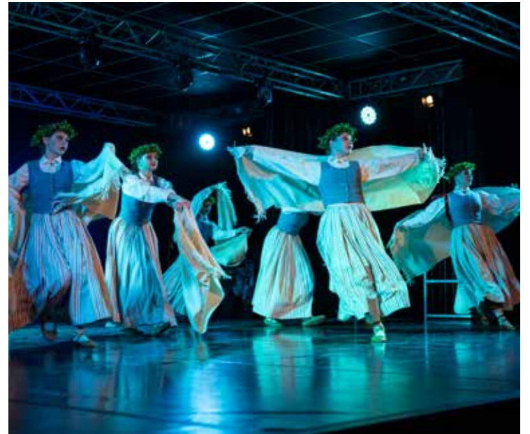
Ventas sniegumā deļā Jūras māte .