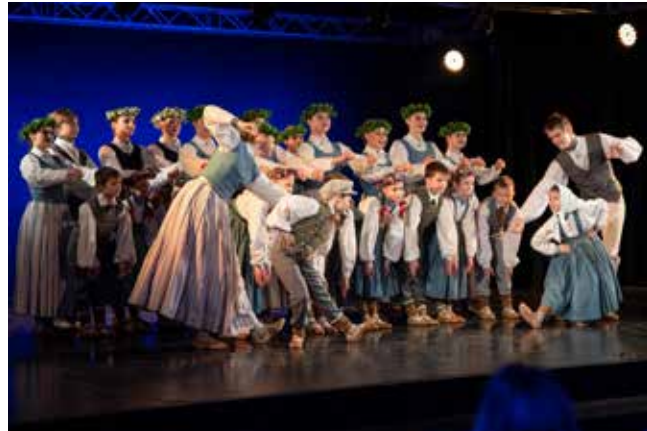
2.–4. klases grupa un Venta deļā Jestrās avitiņas .