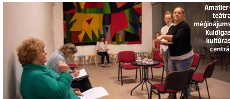
Amatierteātra mēģinājums Kuldīgas kultūras centrā.

svārstās starp desmit un 15. Tas atkarīgs no izrādes, jo, ja lomas nav, uz mēģinājumu nav jānāk. Sezonā tiek iestudēta vismaz viena izrāde.