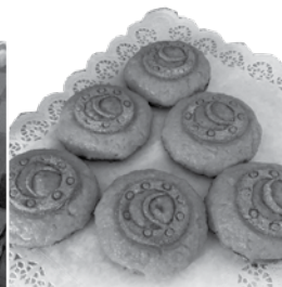
Sklandraušus Dzidra cepot jau sen. Izmēģināts dažāds pildījums, taču nu jau ilgi viņa turas pie pieciem: burkānu, gaļas, biezpiena, maskarpones siera un rabarberu-ābolu.