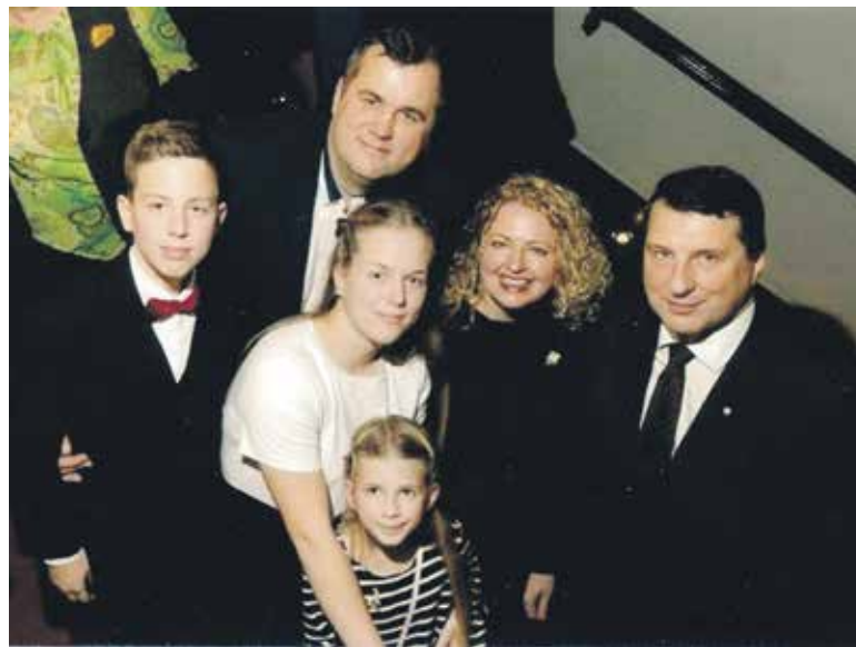
Vaivadu ģimene ar kādreizējo Valsts prezidentu Raimonu Vējoni pirms Latvijas simtgades raidījuma Latvijas Radio.