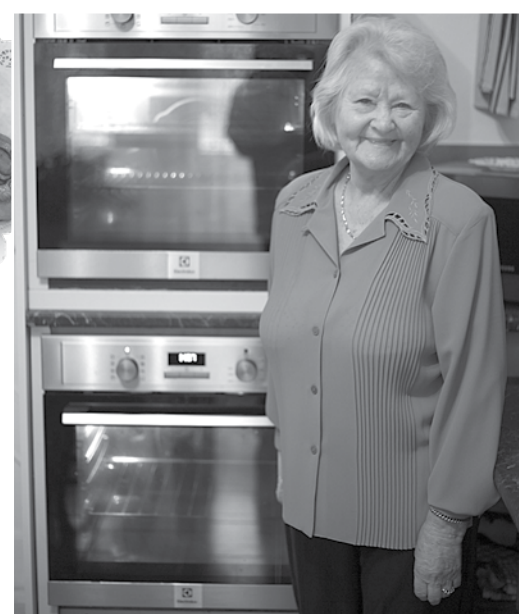
Sklandrauši cepas divās krāsīs, vienā reizē pa 24.

„Taisīju krāsainu dažādu ogu saldējumu, piekrišana bija liela, taču drīz vien radās saldējums Pingvīns . Tomēr krāsaina nebija, tāpēc man pircēji bija tāpat.”