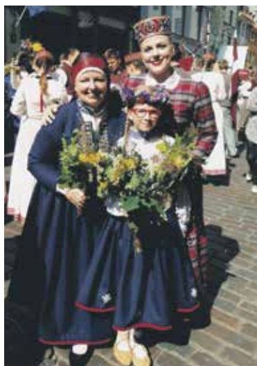
Ar meitām 2018. gada Dziesmu svētkos.