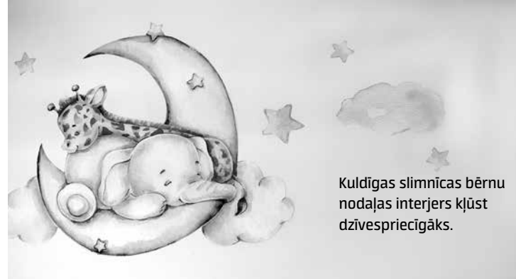
Kuldīgas slimnīcas bērnu nodaļas interjers kļūst dzīvespriecīgāks.

Abas ar kolēģi esam strādājušas tādās nodaļās, kur intensitāte