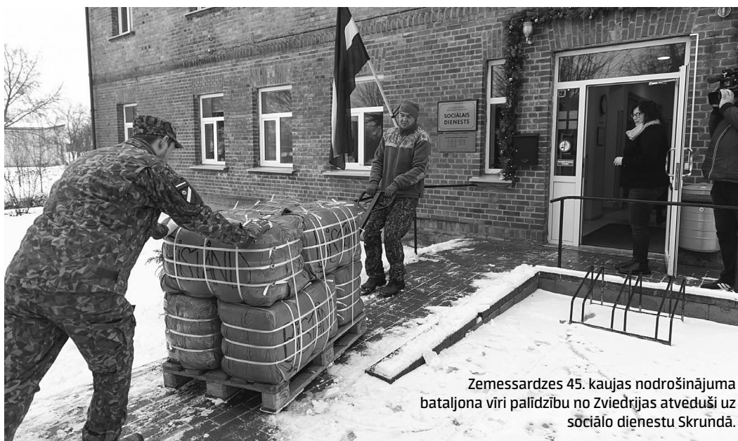
Zemessardzes 45. kaujas nodrošinājuma bataljona viri palīdzību no Zviedrijas atveduši uz sociālo dienestu Skrundā.

Zemessardzes 4. Kurzemes brigādes bataljoni vairākās pašvaldībās, tai skaitā Kuldīgas novadā, nogādājuši Zviedrijas labdarības organizāciju sarūpēto palīdzību. Tā sūtīta trūcīgām, maznodrošinātām ģimenēm, senioriem un kara bēgļu ģimenēm no Ukrainas.