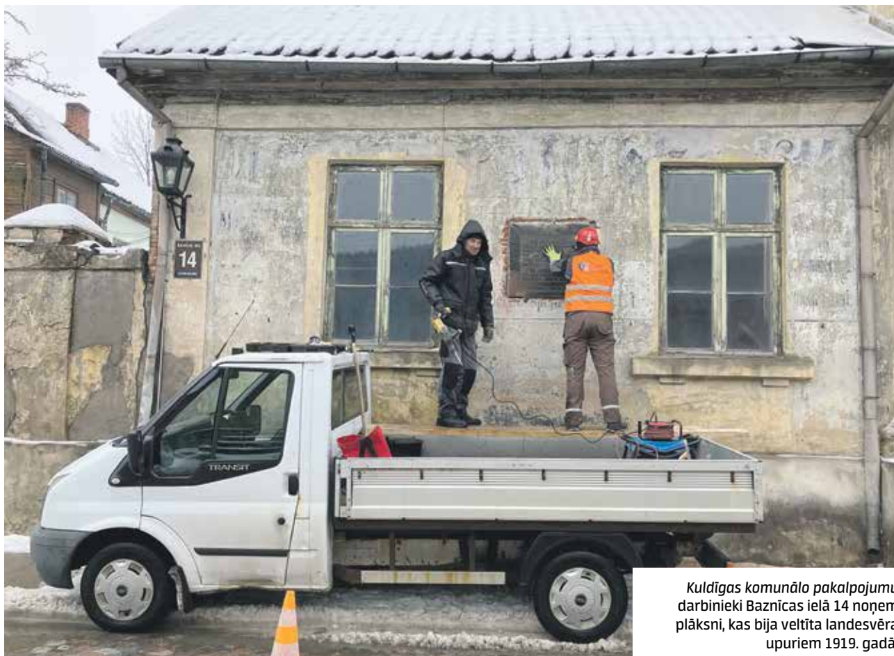
Kuldīgas komunālo pakalpojumu darbinieki Baznīcas ielā 14 noņem plāksni, kas bija veltīta landesvēra upuriem 1919. gadā.