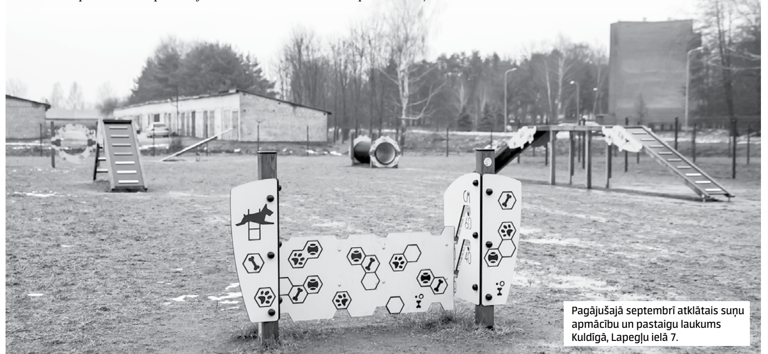
Pagājušajā septembrī atklātais suņu apmācību un pastaigu laukums Kuldīgā, Lapegļu ielā 7.