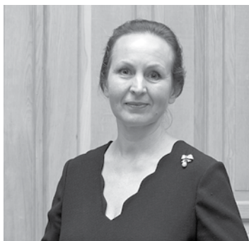
Veselības ministre Līga Meņģelšone Kurzemes medicīnas darbiniekiem sacīja: „Jūs cilvēkiem radāt drošību. Mans darbs būs veltīts tam, lai jūsu drošība un labsajūta būtu tāda pati, kādu to radāt mums.”