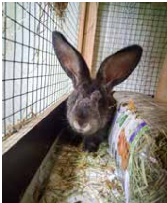
Kāzu dāvana Džute bērnībā. Pirmās izaugušas ausis, tāpēc tās izskatās ļoti lielas.

Tagad abi pirmie draugi – Banijs un Pandijs – jau diemžēl miruši. Pandijs bijis īpaši interesants ar to, ka tam padevusi barveža loma. „Viņš visus kontrolēja, kur kurš drīkst uzturēties, jo visi savā starpā nesatika. Skatījās, lai robežas netiktu pārkāptas un nenotik-