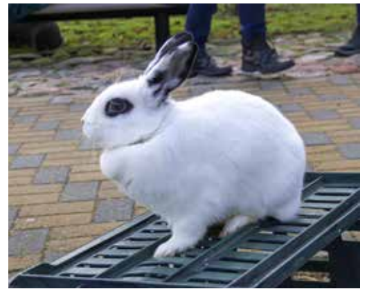
Čiepa iesaukta arī par Napoleonu, jo tai patīk visu iekarot.