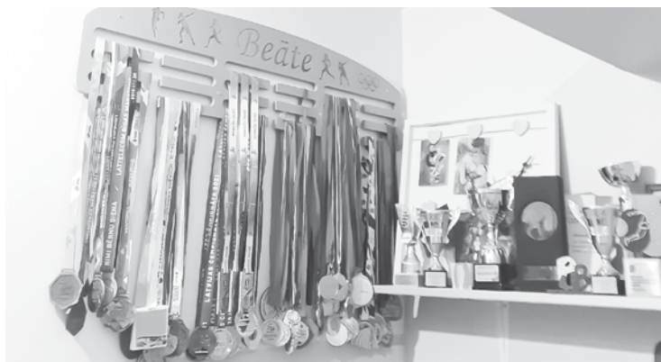
Istabā atvēlēts stūrītis medaļām un kausiem.