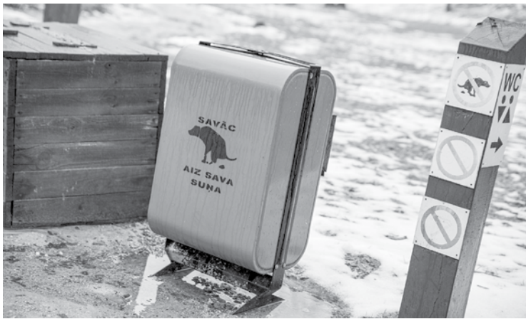
Kuldīgas Pilsētas dārzā atrodas divas šādas atkritumu kastes suņu ekskrementiem. Kādreiz pie tām bija arī maisiņi. Diemžēl neapzinīgas cilvēku uzvedības dēļ tagad to tur nav.

Pērnā gada septembrī Kuldīgā tika atvērts suņu apmācības un pastaigu laukums Lapegļu ielā 7. Diemžēl tajā novērotas dažādas nekārtības, par ko liecina gan sašutuma pilnie komentāri sociālajos medijos, gan kuldīdznieku sūdzības redakcijā.