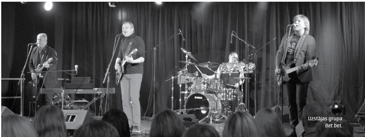
Uzstājas grupa Bet bet .