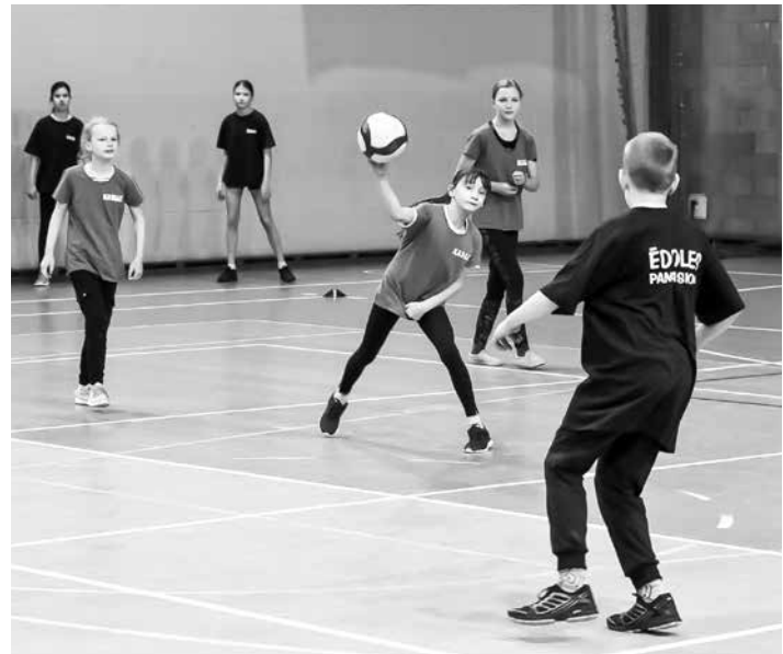
Tautas bumbā sacenšas Ēdoles un Kabiles skolēni.

Lauku skolu grupā sacentās jauktās komandas. Uzvarēja Alsungas, otrajā vietā – Vārmes, trešajā – Z.A.Meierovica Kabiles pamatskola.