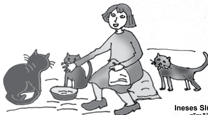
Ineses Slūkas zīmējums

„Šodien biju uz rimčiku – man gandrīz acis aizkrita ciet no cenām! Lētās desas nav. Man tie klīdušie kaķi nāk – citreiz divi, citreiz trīs, reizēm pa vienam. Viņi taču grib ēst! Šodien autoveikals nebija. Autobuss līdz Kuldīgai 95 centi, bet atpakaļ par taksi – desmit eiro. Tas vēl lēti – man tur blāts pie vienas sievietes, citi prasa 14,” saka padurniece Astra Strauss-Štrauss.