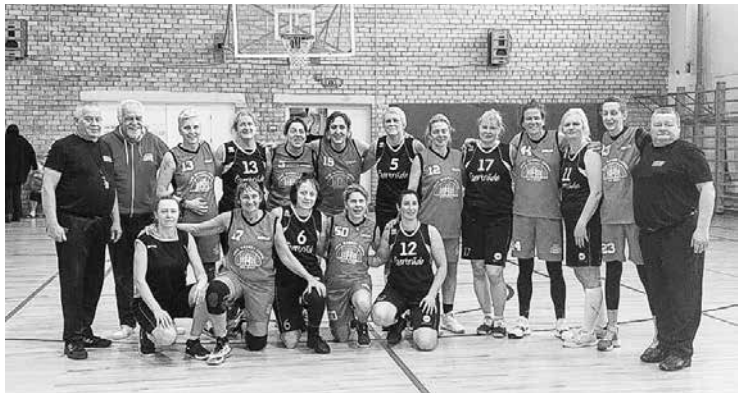
Cēsu kausa izcīņā pēc spēles mirkli iemūžina Kuldīgas Ģertrūde un Itālijas basketbolistes.

Turnīrā pārstāvētas deviņas valstis, 58 komandas spēlējusi trīs vecuma grupās (D35+, D45+, D55+). Ģertrūde startējusi grupā D45+, kur divās apakšgrupās sacentušās desmit vienības. Mūsu basketbolistes uzvarējušas pretinieces no Lietuvas, bet pārējām komandām, kā pašas saka, solīdi zaudējušas. No savas apakšgrupas kuldīznieces izgājušas kā trešās un ar Tukumu no otrās apakšgrupas bijis jāspēlē par 7.–8. vietu. Tukumnieces nav ieradušās, un