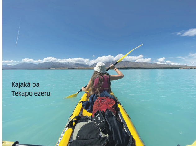
Kajakā pa Tekapo ezeru.