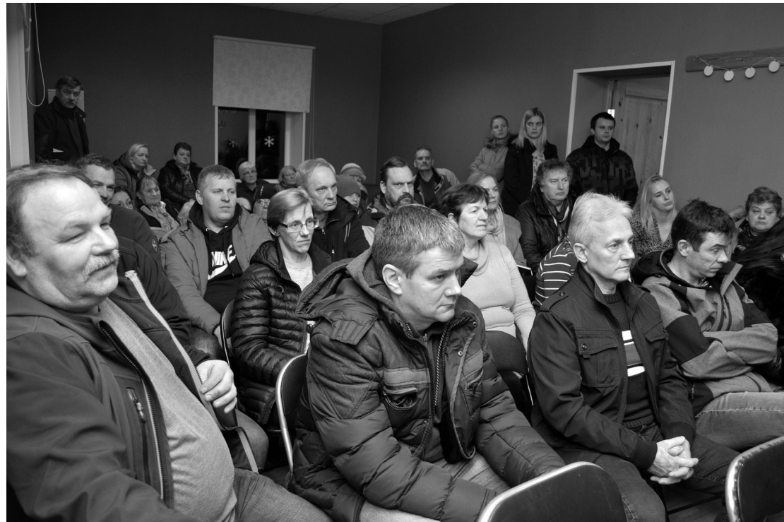
Vārmes daudzdzīvokļu māju iemītnieki satraukti, kā samaksāt ļoti augsto maksu par siltumu, ko piegādā zemnieku saimniecība Atvari.

Vārmes pagasta daudzdzīvokļu māju iemītnieki nav mierā ar augsto apkures maksu. Decembrī tā bijusi 5,97 eiro par kvadrātmetru: par vienistabas dzīvokli jāmaksā vairāk nekā 150 eiro, bet par trīsistabu – 300 eiro.