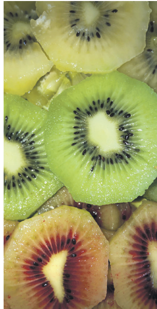
Trīs kivi šķirnes: zelta, zaļais un sarkanais. Pēdējam garša atgādinot dzērveņu un aveņu sajaukumu.