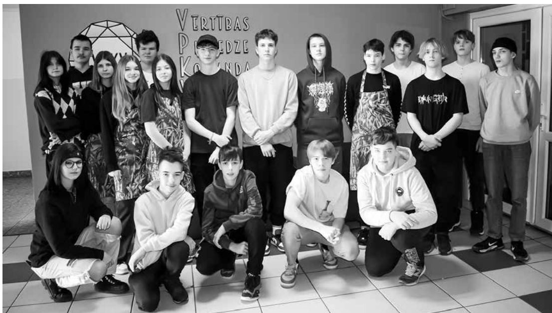
V.Plūdoņa Kuldīgas vidusskolas 8.a klase iesaistījies motivējošajā programmā MOT Latvija .