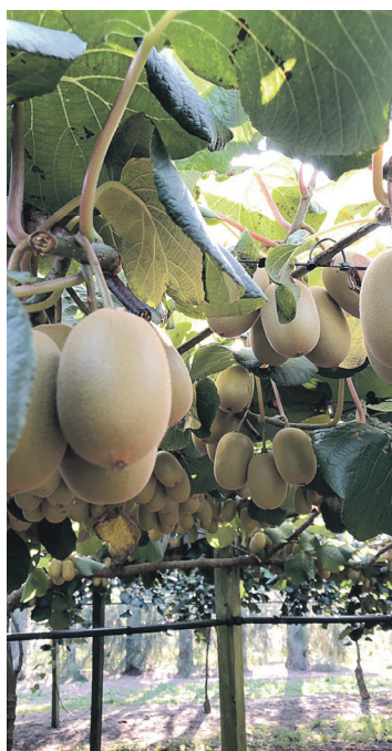
Zelta kivi. Par šo augļu galvaspilsētu pasaulē tiek uzskatīta Te Puke.