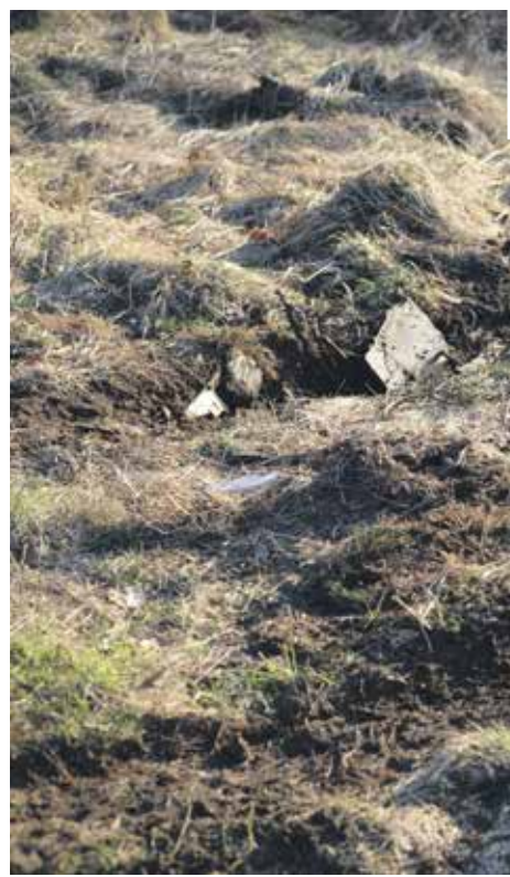
Apvidus auto iebrauktās rīses Veckuldīgas pilskalna valnī.