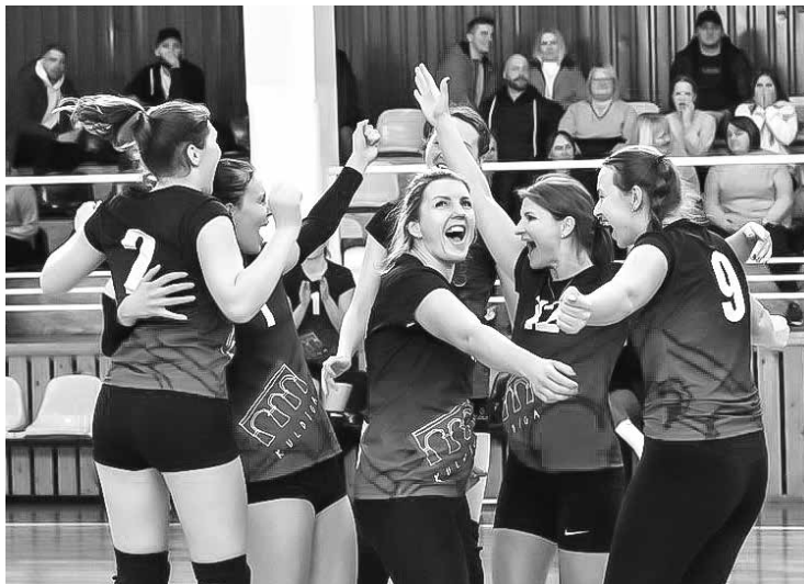
Komanda Kuldīga – novada čempione volejbolā.