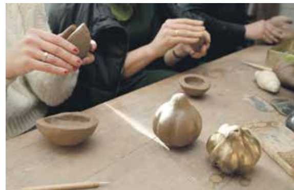
Lai darinātu svilpaunieku, vispirms jāizmīca divas vienāda biežuma bļodiņas.