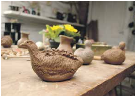
Nodarbībā tapušie darbi.