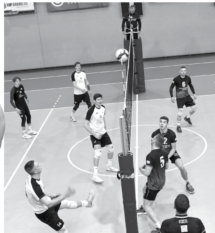
Spēles brīdi – komandas Jelgava un Kuldīga/KNSS.