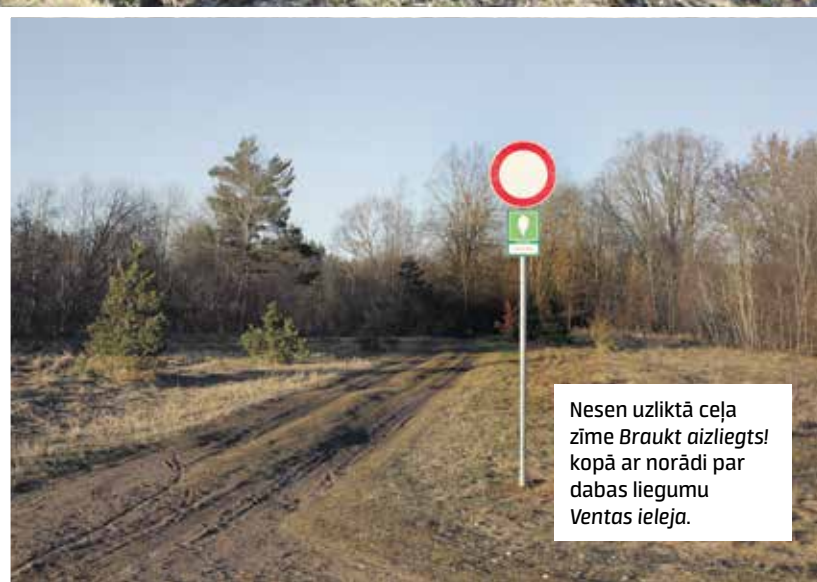
Nesen uzliktā ceļa zīme Braukt aizliegts! kopā ar norādi par dabas liegumu Ventas ieleja .

Likuma Par īpaši aizsargājamām dabas teritorijām 45. panta 1. daļa nosaka: