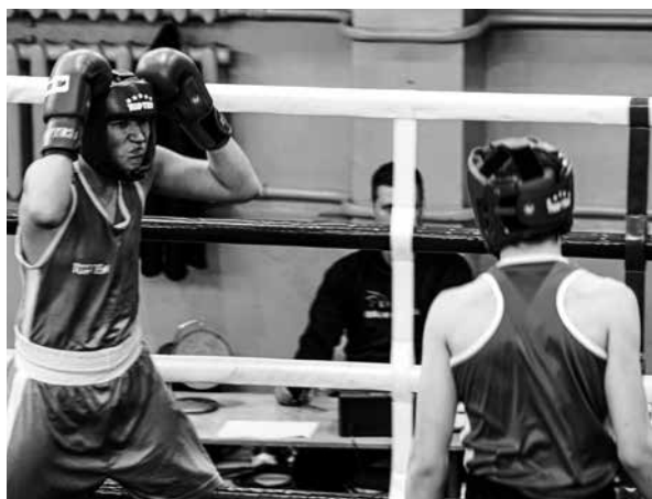
Mirkļi no Kuldīgas novada boksa čempionāta.