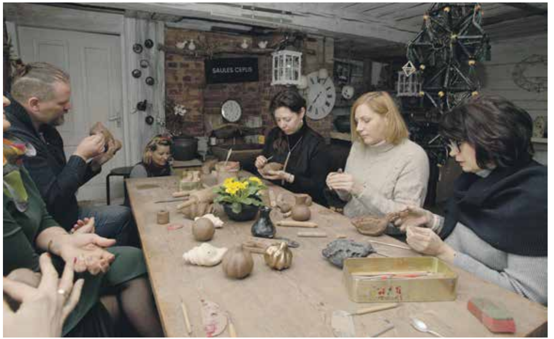
Svilpaunieku darbnīca Padures Saules ceplī .