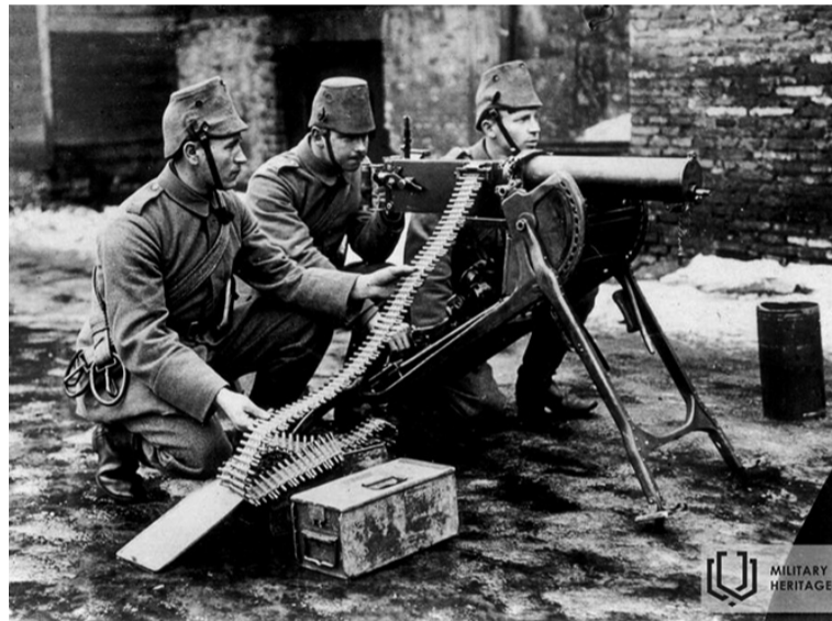
92. Vācijas armijas somu jēgeru ložmetējnieki Liepājā

Lielākā daļa kalnu strēlnieku Vāsā nonāca 1918. gada 25. februārī un nākamajā dienā jau piedalījās parādē, ko pieņēma vēlāk par leģendu kļuvis ģenerālis Karls Gustavs Mannerheims. Jēgeri kļuva par jaunās Somijas armijas mugurkaulu pilsoņu kara. Un, kā raksta Mannerheims savos memuāros, bīstamākais ienaidnieks Brīvības kara nebija sarkanā gvarde, bet 40 000 Somijā dislocētie krievu karavīri. Tie bija jāatbrūno. Augstāko Somijas militāro pakāpi saņēmuši septiņi strēlnieku virsnieki, 26 – ģenerālmajora, 16 – ģenerālleitnanta, 89 – pulkveža. Laikā no 1926. līdz 1959. gadam, neskaitot kara gadus, bruņoto spēku komandiera amatā bija kalnu strēlnieki.