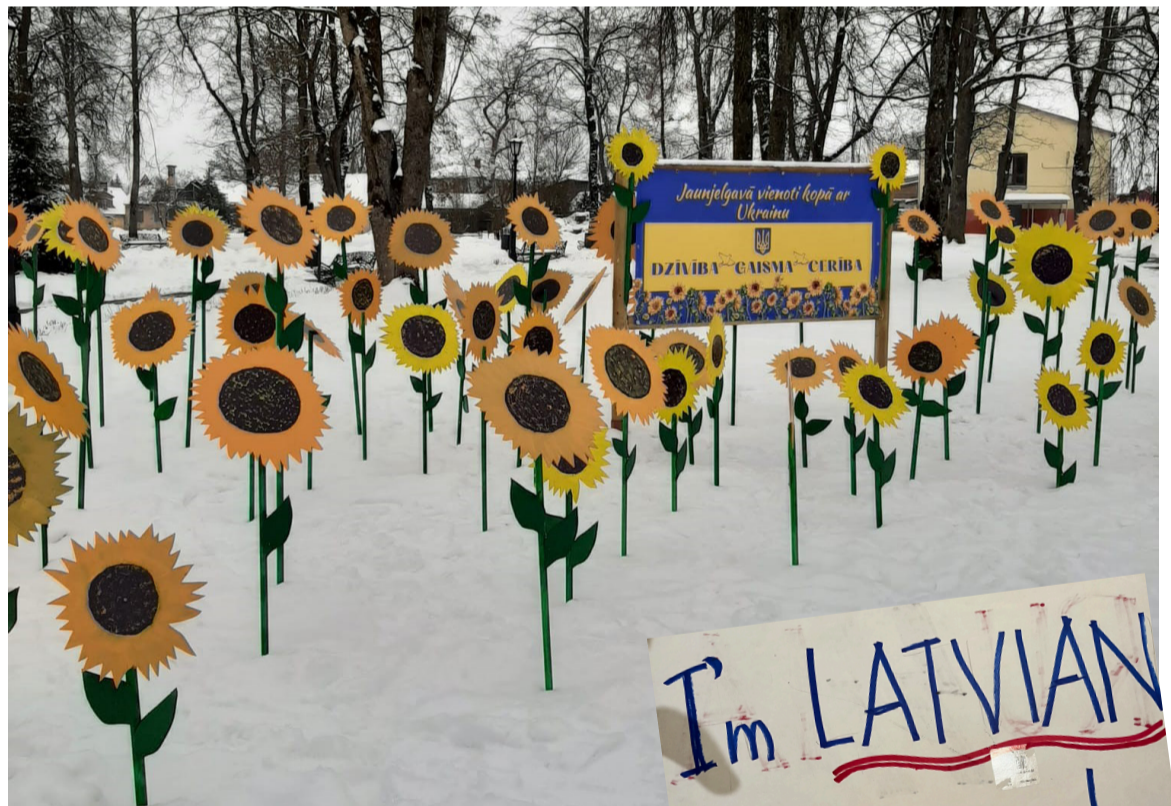
Saulespuķu dārzs Jaunjelgavā