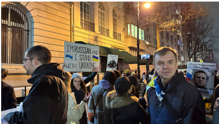
Demonstrācijā Ņujorkā piedalījās arī krievu cilvēki ar plakātiem, kas vēstīja "I'm Russian and I support Ukraine"