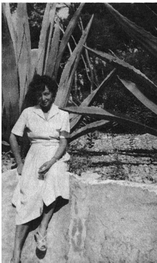
Francijā 1959. gadā

Agrākajos gados, kuŗa laikā dzīvojot Kairā, sāku tulkot Rilkes dzeju. Starp 1942. un 1944. gadu mani tulkojumi parādījās trīs literārajos žurnālos: The Citadel (Kairā), Forum (Palestīnas radiofona literārajā žurnālā, Jeruzālemē) un 17 tulkojumi žurnālā Personal Landscape (Kairā; pazīstamā rakstnieka Lorensa Darella ( Lawrence Durrell ), The Alexandrian Quartet autora, rediģēts). Kairā 1942. gadā iznāca arī mans Rilkes tulkojumu krājums Selected Poems . 1943. gadā vairākus manus Rilkes tulkojumus pārraidīja Palestīnas radiofons, un 1951. gada martā bija raidījums arī BBC trešajā programmā, Londonā, ar atkārtojumiem 31. martā un 21. augustā.