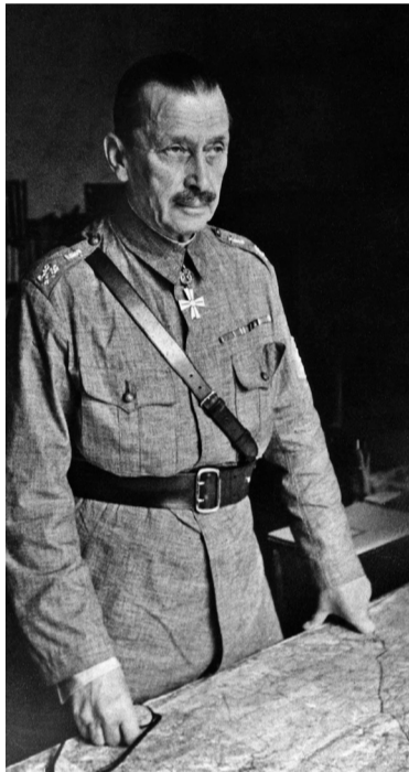
Karls Gustavs Mannerheims

žādiem ceļiem, pat pāri aizsalušajam Botnijas līcim ar slēpēm, somu brīvprātīgie nonāca Vācijā. 1916. gada pavasarī tika izveidots 27. Karaliskais Prūsijas kalnu strēlnieku bataljons. Tajā pašā gadā somu jēgerus nosūtīja uz Vācijas austrumu fronti Latvijā – pie Olaines un Klapkalnciema. Maijā Latvijā jau bija ap pusotru tūkstoti somu kalnu strēlnieku, to uzdevums bija aizsargāt ap sešu kilometru garu purvainu teritoriju Mīsas upes rajonā. Somi, tāpat kā latviešu strēlnieki, ilgi mirka purva tranšējās, un, kaut