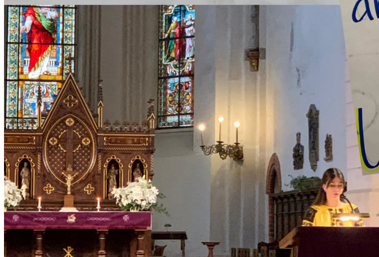
24. februārī Doma baznīcā aizlūgumā svētos rakstus lasa ukraiņu meitene