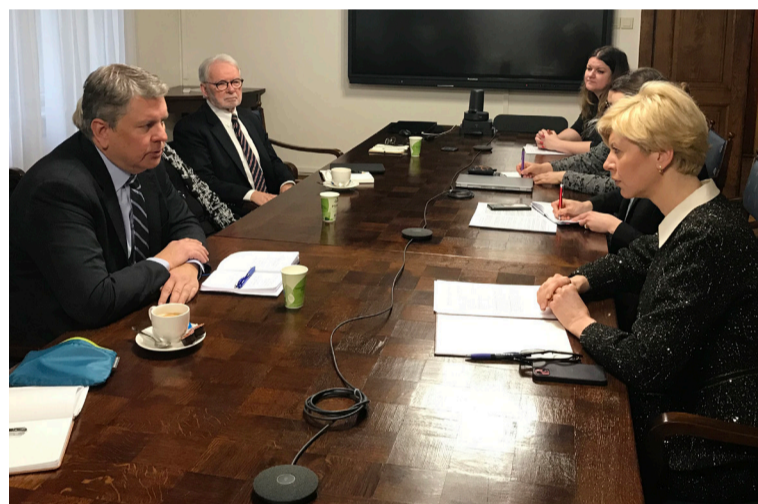
Tiekoties ar Izglītības ministri Andu Čaksu

Krišjānis Kariņš bilda, ka viņš ir pastāvīgs Amerikas latviešu laikraksta Laiks abonents un lasītājs Rīgā, un ka tādējādi viņš arī cenšas sekot līdzi visam, kas notiek diasporā.