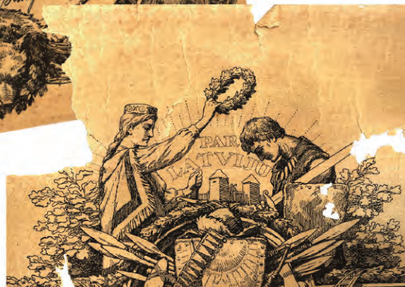
Lāčplēša Kara ordeņa kavaliera diploma fragments. Zīmējuma autors - mākslinieks Rihards Zariņš. No Ādažu Vēstures un mākslas muzeja kolekcijas.

turpmāk būtu novilkta gar Gauju. Ja tā būtu noticis, iespējams, mūsu novads būtu Igaunijas pierobežā.