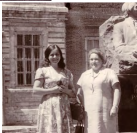
Ar mīlo māsu Genuti jaunībā

centrā. Pateicoties tai, biju kārtīgi sagatavota augstskolai. Vienā no pēdējiem kursiem mēs ar kursabiedriem devāmies ekskursijā, pārgājienā, līdz kādā brīdī, sadalījušies vairākās grupās, pazaudējām