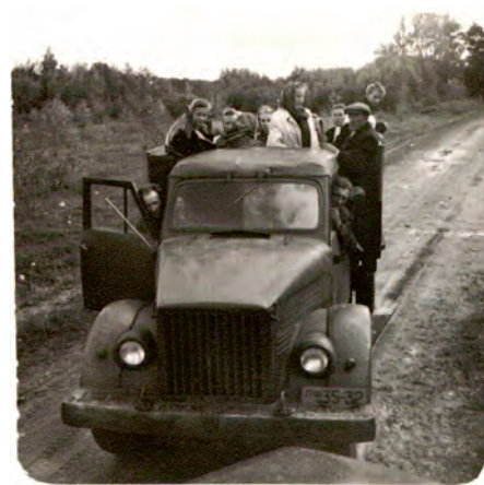
Ekskursija slimnīcas darbiniekiem. 50. gadu beigās.

1960. gadā Ādažu slimnīcas pavēļu grāmatā tika izdarīti divi vēsturiski svarīgi ieraksti – pirmkārt, aprīlī pēc Rīgas rajona Veselības aizsardzības nodaļas