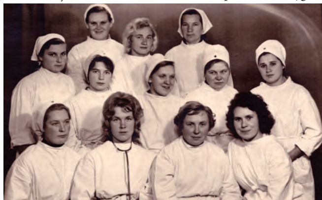
Daktere Deifta jaunībā Māsu skolā. Pirmajā rindā no labās.

Pat pēc 52 darba gadiem ārsta praksē viņa atceras katra bērna dzimumzīmi. "Vienmēr, vienmēr prasu, lai eņģeļi-