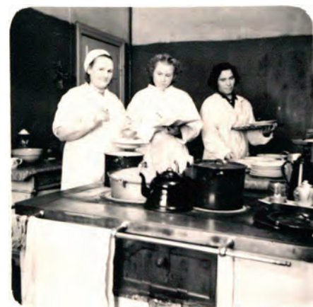
Slimnīcas virtuvē. 60. gadi

“45 gadi Ādažu slimnīcā aizskrēja kā mirklis. Palicis gandarījums par padarīto, ka esmu arī kādu mazu daļiņu no sevis atstājusī Ādažos,” mazliet klusināti nosaka sirmā ārste. Bet dakteres dzīvesbiedrs neļauj mums ieslīgt nostaļģijā par pagājušajiem gadiem, viņš tuvojas mūsu