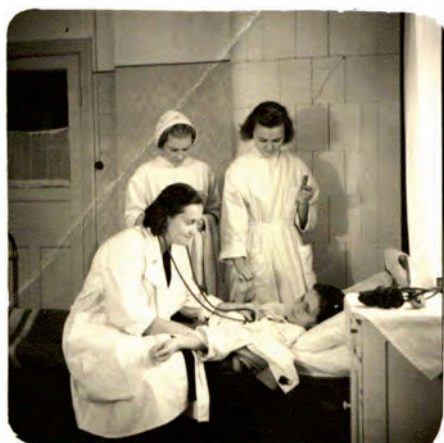
Pie pacienta. 60. gadi

Stāsta daktere A.Zara: “Pacientu slimnīcā pa šiem gadiem bijis liels skaits. Uz Ādažiem ārstēties brauca no visa Rīgas