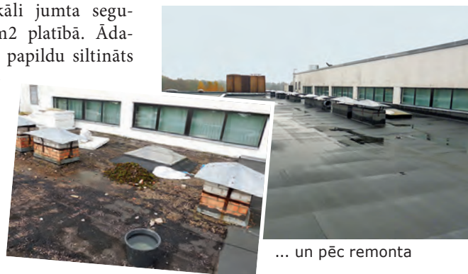
Skolas jumts pirms...

bērnudārzā veikti lokāli jumta seguma remontdarbi 269m 2 platībā. Ādažu vidusskolā – jumts papildu siltināts un ieklāts jauns jumta segums (1940m 2 ). Ādažu Sporta centrā veikta pilnīga vecā jumta seguma un siltinājuma demontāža un jauna jumta siltinājuma un seguma ieklāšana 123m 2 platībā.