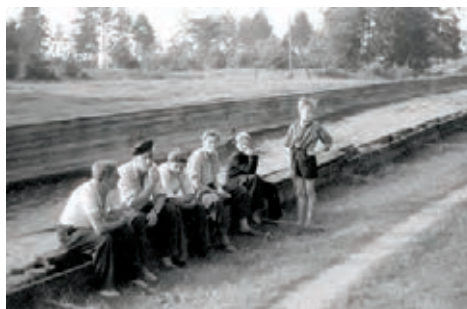
Baltežera kanāls pretī Alderiem 1963. g.

Jo vecāks koks, jo tam pa žuvu šāks viducis, tādēļ vieglāk peld pa augšu. Plostniekiem bija viena sarežģīta vieta Gaujā, ko sauca par “Ķeizara kapiem”. Mūsu brigadieru noņē-