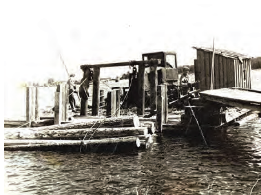
20.gs. 60. gadi. Plenējamais aparāts Mazajā Baltezerā.