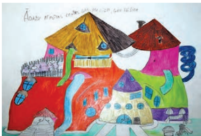
Evelīna Āboliņa, Ādažu vidusskolas 5.C klase.

Ādažu novadā pastāvīgi palielinās iedzīvotāju skaits (atbilstoši Pilsonības un migrācijas lietu pārvaldes datiem, 2015. gada 1. janvārī Ādažu novadā bija deklarēti 10714 cilvēki), turklāt, salīdzinot ar situāciju Latvijā kopumā un novadiem Pierīgā, Ādažu novadā ir viens no lielākajiem bērnu līdz darbaspējas vecumam īpatsvars kopējā iedzīvotāju skaitā – 21% (Pierīgā tikai Mārupes novadā cilvēku līdz 16 gadu vecumam īpatsvars ir vēl lie-