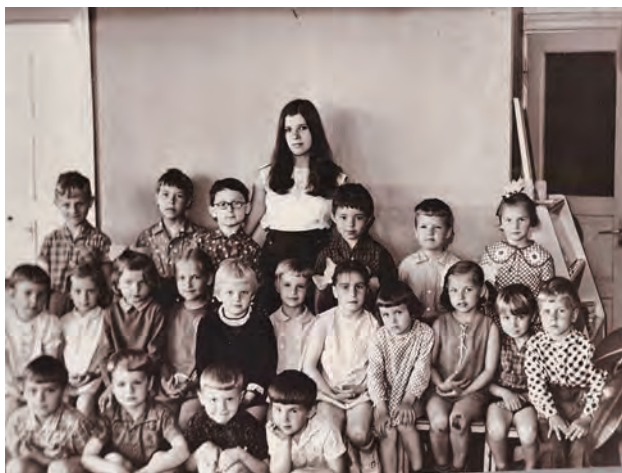
Pirmie audzēkņi Rīgas-Jūrmalas Mežrūpniecības bērnudārzā Babītē. Izlaidums – 1972.g.

Mūsu dārziņā visas var dēvēt par ģimeniskajām grupām tieši tādēļ, ka izmantotam visas metodikas. Ja iziesiet pa grupiņām, redzēsiet, ka mums ir dažādas pupiņas, sēkliņas, ir darbi no makaroniem, mannas, tas viss nodrošina dažādu maņu attīstību. Viens labāk uztver informāciju ar redzi, cits – ar dzirdi, vēl kāds – ar tausti, kustībām. Ne visiem bērniem patīk pētīt skudras. Dažs, tās ieraugot, spiegdams skrien prom. Tikko,