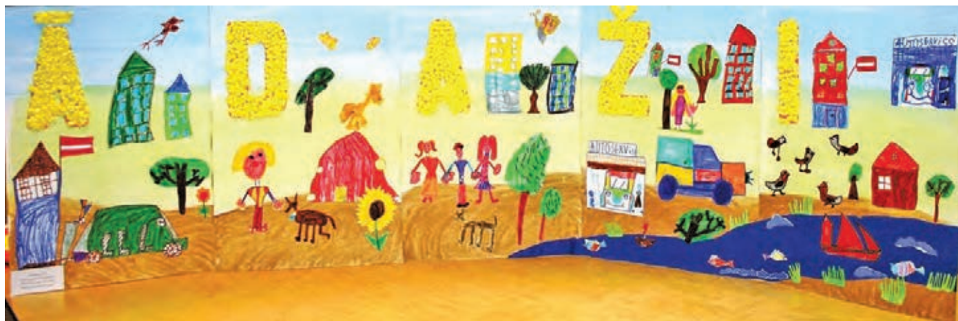
Kadagas pirmsskolas izglītības iestādes „Ezišu” grupiņas darbs