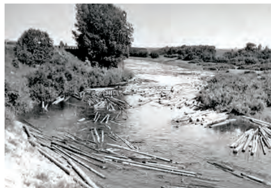
Koku pludināšana Gaujā. 1965. gads.

Jā, viņi bija dzīvojuši kaut kur ap Ādažu muižu. Vallijas ( Ē. Gumbelja sieva aut. piez. ) tēvs ar māti bija dzīvojuši Alderī –