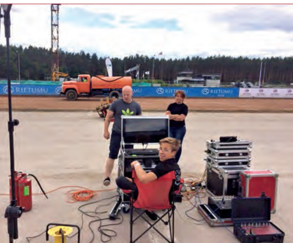
Salūta vadības centrs "Speedway Riga grand prix 2015"