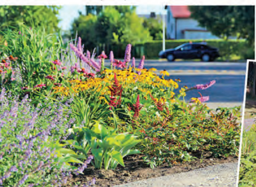
▲▶ Ādaži rotājas ziedu rotās!