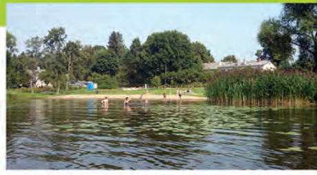
▲ Alderu pludmale – tagad sakopta un skaista. Ādažu novada domes Saimniecības un infrastruktūras daļas darbinieki rūpējas par kārtības uzturēšanu pludmalēs.