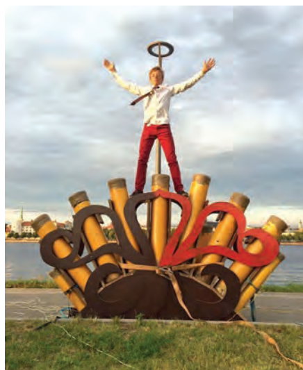
Stundu pirms Latvijas skolu jaunatnes dziesmu un deju svētku salūta.