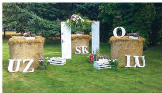
▲ Par spīti 1. septembra lietum un vējam, ainavu arhitektes Ivetas Grīviņas veidotais foto stūrītis par godu 1. skolas dienai priecēja daudzus, kā arī guva lielu atzinību sociālo tīklu lietotāju vidē!