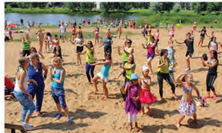
▲ Vasaras vidū Vējupes pludmalē – viens no vērienīgākajiem fitnesa pasākumiem Latvijā – otrs "Zumba fitness" festivāls!

◀ Hortenziju dienas skaistajā dārzā "Saulesķiršos" Saules ielā 8!