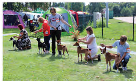
▲ Laiks sevi parādīt! Starptautiskajā suņu izstādē Ādažos tās dalībniekus vērtē 15 starptautiskās kvalifikācijas eksperti no Somijas, Zviedrijas, Portugāles, Bulgārijas, Igaunijas, Krievijas, Polijas un Lietuvas.