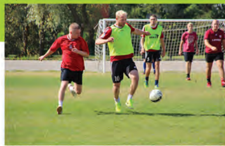
▲ Spraiga spēle Ādažu novada kausa izcīņā minifutbolā.

◀ Pricīgā gaisotnē kopā ar mīļākajiem multfilmu varoņiem Ādažu bērnudārzā sagaida 1. septembri.