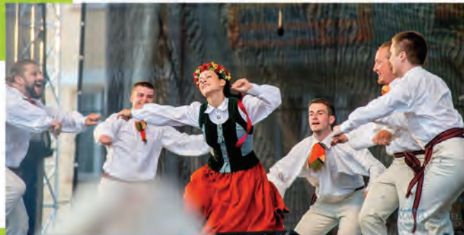
▲ Lieliska deja! Jūlija beigās tautas deju ansamblis "Sprigulītis" uzstājas festivālā Polijā!

◀ Hortenziju dienas skaistajā dārzā "Saulesķiršos" Saules ielā 8!