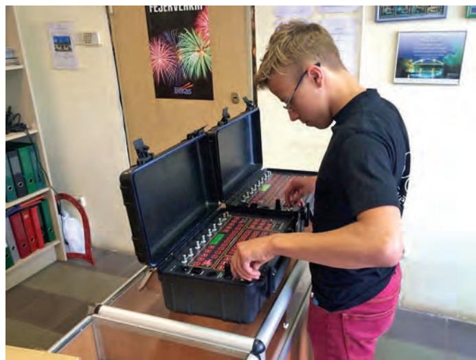
Aplūkojot tikko saņemtais jaunās pultis.