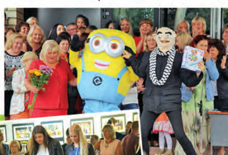
◀ Mirkļis, kad pēdējo klašu skolēni skolā ievēd pirmklasniekus, vienmēr ir īpašs.