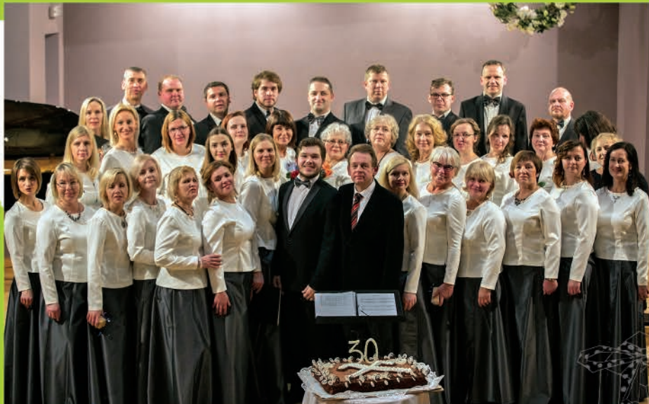
▲ 3. decembrī Ādažu Kultūras centra jauktais koris "Jumis" Ceriņu zālē svinēja savu 30 gadu jubileju. Suminām!

▲ Ādažu uzņēmumā "Pelegrin", kur ražo pasaulē ātrākās lidmašīnas ultravieglu lidaparātu klasē, viesojas delegācija no Ķīnas, pārstāvji no Aviācijas asociācijas un Latvijas Investīciju un attīstības aģentūras.