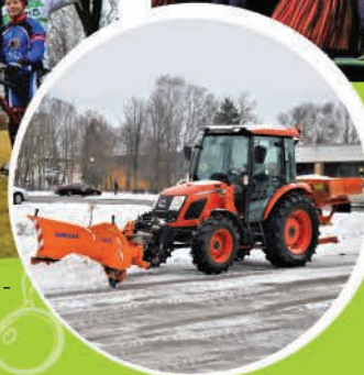
◀ Jaunais domes traktors darbībā, uzkopjot Ādažu ielas.