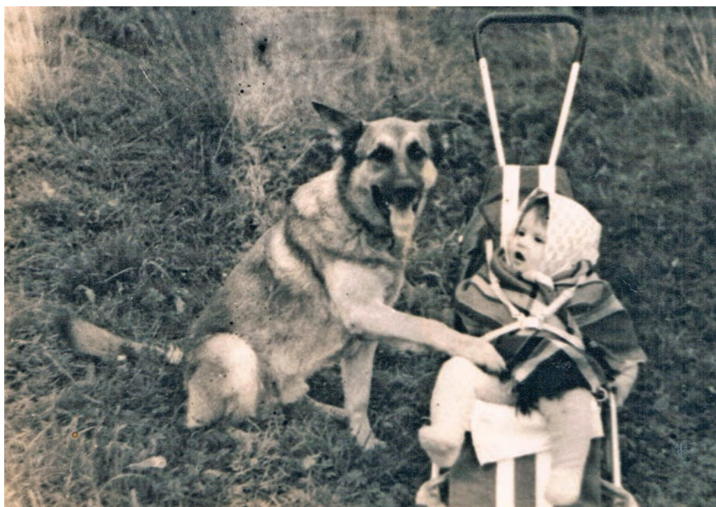
Bērnībā kopā ar suni Džeku.