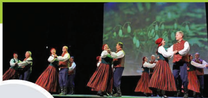
▲ Lāčplēša dienā deju kopa "Sprigulis" kopā ar draugiem no Rundāles novada, folkloras kopu "Svitene" uz skatuves izdzīvoja brīnišķīgu koncertu "Latvija gadalaikos"!

▲ Paldies "ĀdažiVelo" par sportisko Latvijas kontūras sveicenu Ādažu novada kartē!