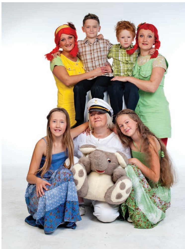
Fotosesija šovā "Latvijas dziedošās ģimenes".