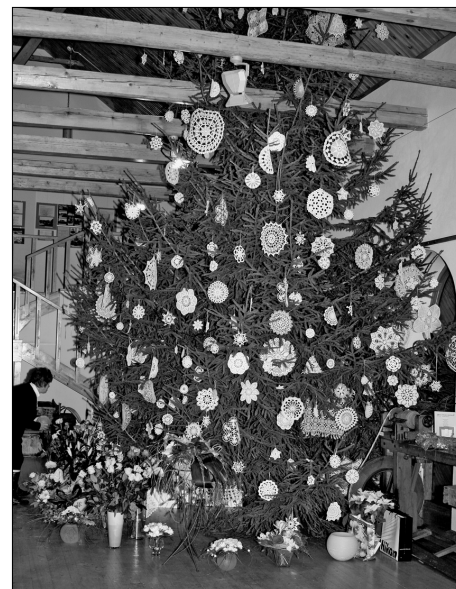
Netradicionālā Ziemassvētku egle

Latgales Mākslas un amatniecības centrs 5 gadu pastāvēšanas laikā ir jau apliecinājis se-