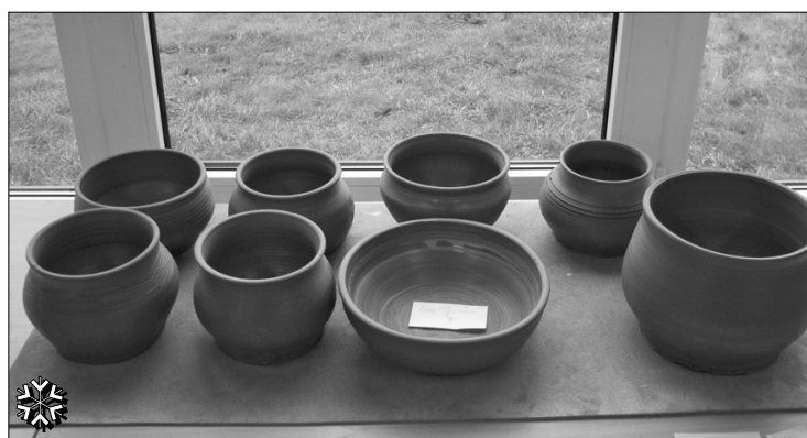
Deputātu gatavotie trauki

statuss (dalībniekus izvirzīja Līvānu novada domes sociālais dienests).