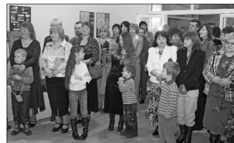
Latgales mākslas un amatniecības centra jubilejas pasākums