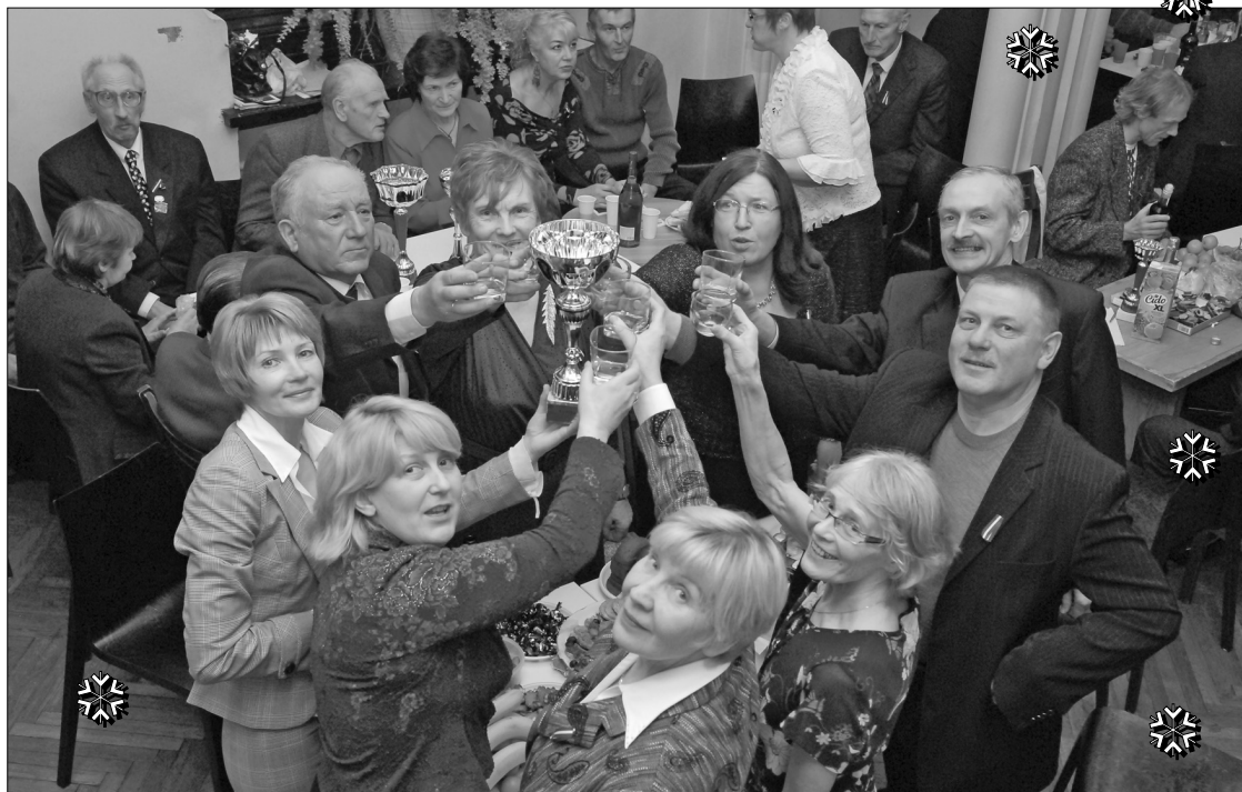
Līvānieši priecājas par gūtajām uzvarām

2008. gada 30. novembrī Rīgā Lielajā Ģildē notika Latvijas Sporta Veterānu (senioru) Savienības (LSVS) astoņpadsmitā atskaišu - vēlēšanu konference un divpadsmitais salidojums, kur apbalvoja Līvānu novada sportistus, kas ieguvuši pirmo vietu LSVS spēlēs un godalgoto vietu ieguvējus Eiropas un pasaules čempionātos.