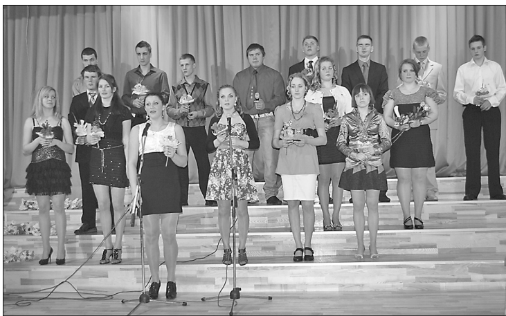
Rudzātu vidusskolas 12. klases jaunieši, laimīga ceļa vēlējumus un Rudzātu vidusskolas žetonus saņemot

jaunākās baumas par katru no 12. klases skolēniem. Skolēni kopā dejojā jau zināmas un arī jaunas, iepriekš neredzētas dejas. Koncertā tika daudz un spraigi dziedāts, un vakara gaitā visi klātesošie tika pārsteigti ar pašu skolēnu domātu un iestudētu ēnu teātri, kas Rudzātu vidusskolā bija kas jauns. Pasākuma gaitā ik viens no klātesošajiem varēja pārliecināties, ka šī klase ir ļoti draudzīga un saliedēta gan ikdienas gaitās, gan brīžos, kad nepie-