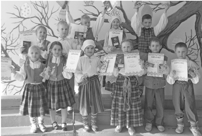
■ Folkloras kopas "Ceiruleiši" jaunākā grupa

Bet cik vēl ceiruleišu dejoja tradicionālo deju konkursā "Vedam danci!". Bijām (kā jau ierasts) viskoplāk pārstāvētā folkloras kopa. Uz finālu Rīgā dosies gan Skalu un Dvieļu deju dejotāji, gan pāru deju dejotāji un Novadu programmas dejotāji. Paldies Imanta Krūmiņa vectēvam par sniegto atbalstu, gatavojoties deju konkursam!