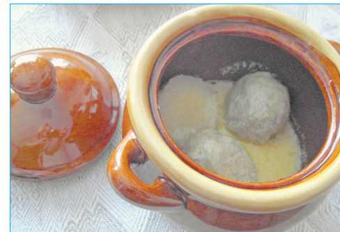
■ Līvānu firmas ēdiens

Kā jau tika minēts iepriekš, turpmāk Līvānu novada firmas ēdiena recepte tiks izvietota Latgales mākslas un amatniecības centra vēsturiskās ekspozīcijas jaunizveidotajā stendā – Latgales kulinārais mantojums. Līvānu novada firmas ēdiens tiks reklamēts ar tūrisma saistītās izstādēs, pasākumos un iespieddarbos, tāpat Līvānu novada firmas ēdiens tiks iekļauts konkursā uzvarējušās ēdināšanas iestādes ikdienas ēdienkartē, ļaujot to nobaudīt visiem interesentiem, bet galvenokārt visiem Līvānu novada viesiem. Latgales mākslas un amatniecības centra kolektīvs, Līvānu novada dome un konkursa komisija, vēlas vēlreiz pateikties visiem konkursa dalībniekiem par atsaucību, uzdrīkstēšanos un ieguldīto darbu.