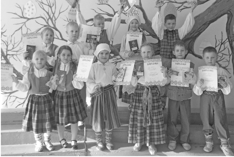
■ Младшая группа фольклорного ансамбля "Ceiruleits"