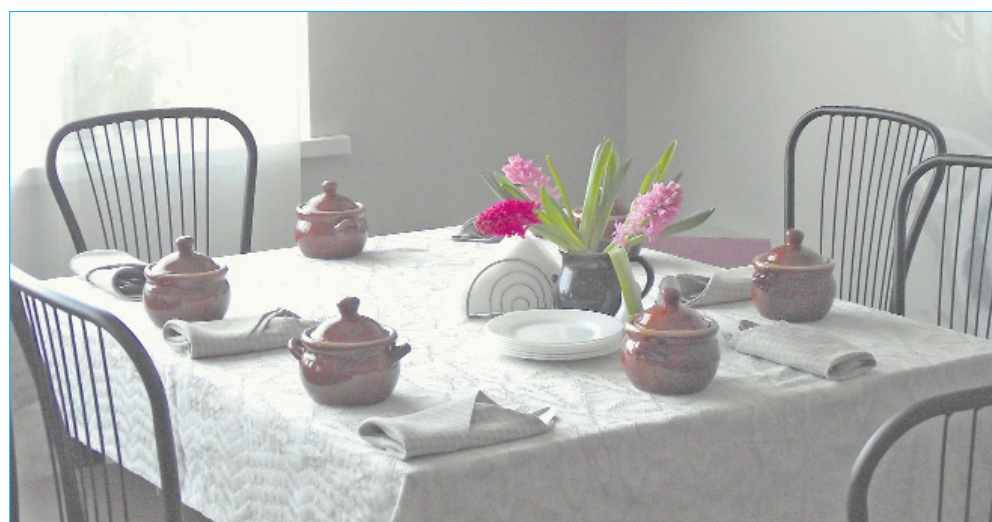
■ Konkursa dalībnieku – SIA "Sipres" – klātais galds

►► Inita Paegle, LMAC kultūras tūrisma organizatore