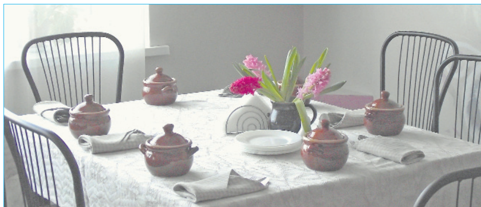
■ Стол, накрытый участником конкурса ООО "Sipres"