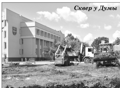
Сквер у Думы

Лицо города – самая центральная площадь у здания краевой администрации скоро полностью изменится. Она запланирована как репрезентативная площадь, одновременно для жителей будет создано новое место для отдыха. Будет заменена структура насаждений, расположение дорожек. Предусмотрено строительство дорожного полотна трех видов: бетонная брусчатка, в некоторых местах гранитные булыжники и асфальт на проезжей части. Запланированные дорожки обеспечат доступность к окружающей среде, которой до этого не было. На территории будут заменена почва, разведены газоны и насаждения. По мере возможности будут сохранены уже растущие деревья, некоторые уже срублены. На территории предусмотрено разместить скамейки, одна из которых будет дизайнерским проектом – „Скамейка депутата”, таким образом, продолжая внедрение в городскую среду Ливан художественно спроектированных скамеек как объектов окружающей среды.