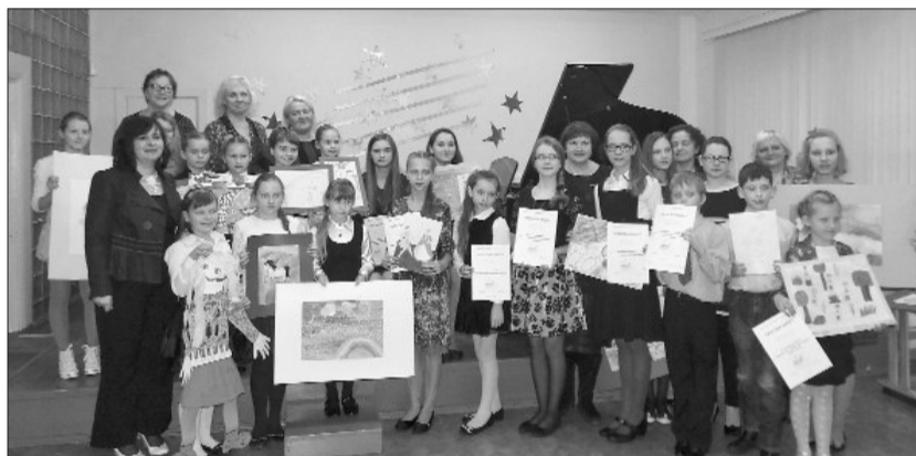
■ Emocijas, ko sniedz klasiskā mūzika, var ietērp ne tikai skaņās, bet arī krāsainās gleznās.

Pasākums ar nosaukumu „Mūzika ar otu” izvērtās savdabīgs un interesants. Šoreiz apkārt flīģelim uz skatuves bija redzami arī molberti, uz kuriem krāšņojās audzēkņu zīmējumi. Katrs jaunais mākslinieks attēloja skaņdarbu tā, kā bija iztēlojis to apgūstot. Pasākuma apmeklētājiem bija iespēja iedziļināties bērnu muzikālo tēlu pasaulē, vērojot zīmējumus, kā arī to veidot un izspāņot pašiem, klausoties