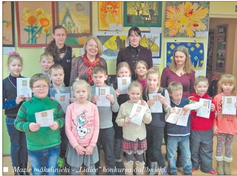
Mazie mākslinieki - „Lidice” konkursa dalībnieki.

14.janvārī Līvānu BJC noslēdzās VISC organizētā konkursa "Lidice - 2015" Līvānu novada kārtas jauno mākslinieku darbu izstāde. ANO 2015.gadu pasludinājusī par Gaismas gadu. UNESCO Čehijas Republikas Nacionāla komisija aicināja 43.Starptautisko bērnu mākslas izstādi - konkursu „Lidice 2015” veltīt tēmai „Gaisma”. Kopumā konkursā piedalās 38 dalībnieki no Līvānu novada skolām. Konkursa 2 kārtai, kura notiks Rīgā, tika atlasīti 36 dažādās vizuālās mākslas tehnikās veidoti jauno mākslinieku darbi. Paldies par atsaucību! Radošu veiksmi turpmākajos konkursos un citās mākslinieciņajās izpausmēs!