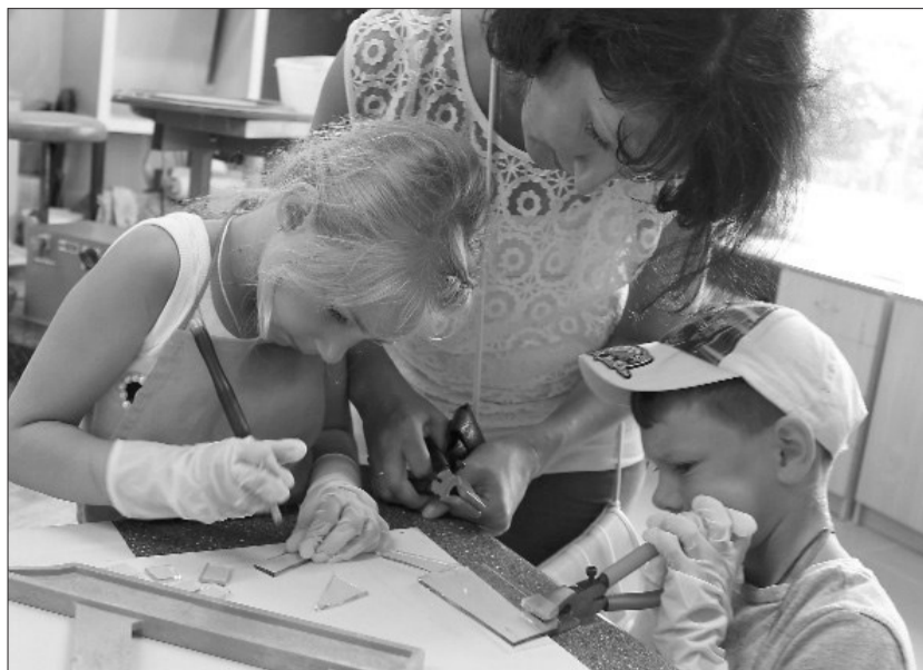
■ Ar lielu aizrautību iespēju izgatavot savu – īpašu un neatkārtojamo – suvenīru no stikla izmanto ne tikai bērni, bet arī pieaugušie.

Radošā apvienība „Perspektīva” realizēja Līvānu novada domes Mazo grantu projektu, kura rezultātā notika vairākas radošās darbnīcas. Darbnīcu dalībniekiem bija iespēja apgūt praktiskas iemaņas darbā ar stiklu, izgatavot savus radošos darbus stikla materiālā, kas tika izkausēti un apstrādāti. Projekts deva iespēju iegādāties darbarīkus un materiālus. Ir noorganizēts stikla kausēšanas pulciņš, kurā notiek regulāras nodarbes. Pašlaik ir iespēja, iepriekš piesakoties, darboties radošajā darbnīcā ne tikai individuāli, bet arī grupās. Šīs iespējas aktīvi tiek izmantotas. Darbnīcā šobrīd ir vairāki darba rīku komplekti, pieejami materiāli darbam ar stiklu, darbnīcu dalībniekiem tiek piedāvāti ērti darba priekšauti.