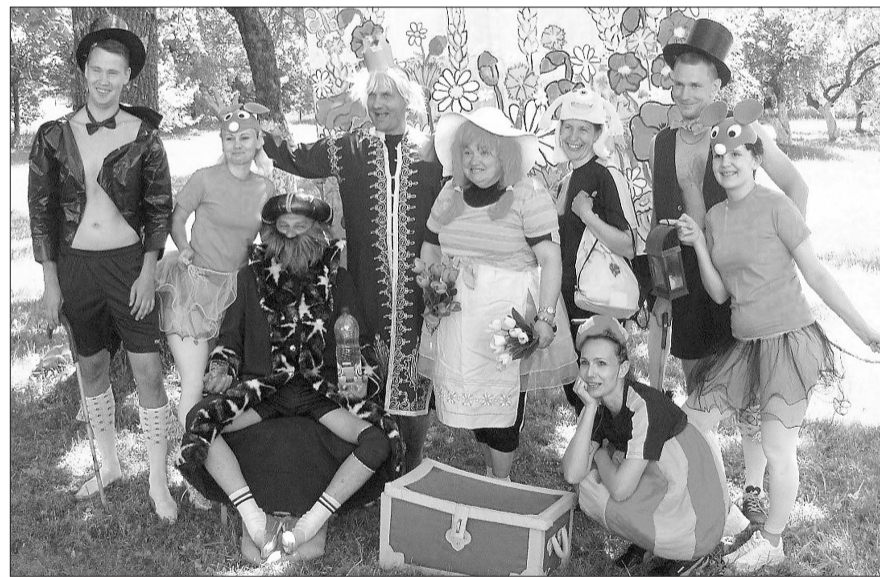
■ Sporta svētku uzvarētāji - atraktīvā Aleksandrovas skolas komanda

tīva īsto kodolu. Ja pasākums ir izdevies, tad paldies ir pelnījuši visi.