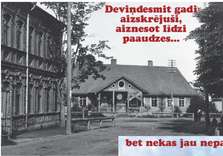
Devīdesmit gadi aizskrējuši, aiznesot līdzī paaudzes...

Daudz baltu dieniņu, pilsēta - mana un tava!