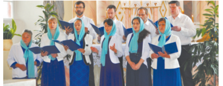
■ Jauki, ka Līvānos konfesijas draudzes savā starpā! Vladimiras Dievmātes ikonas pareizticīgo draudzes kora fascinējošais dziedājums šoreiz piepildīja katoļu baznīcas velves.

dzēja tieši Renārs Kaupera balss un "Prāta vētras" mūzika.