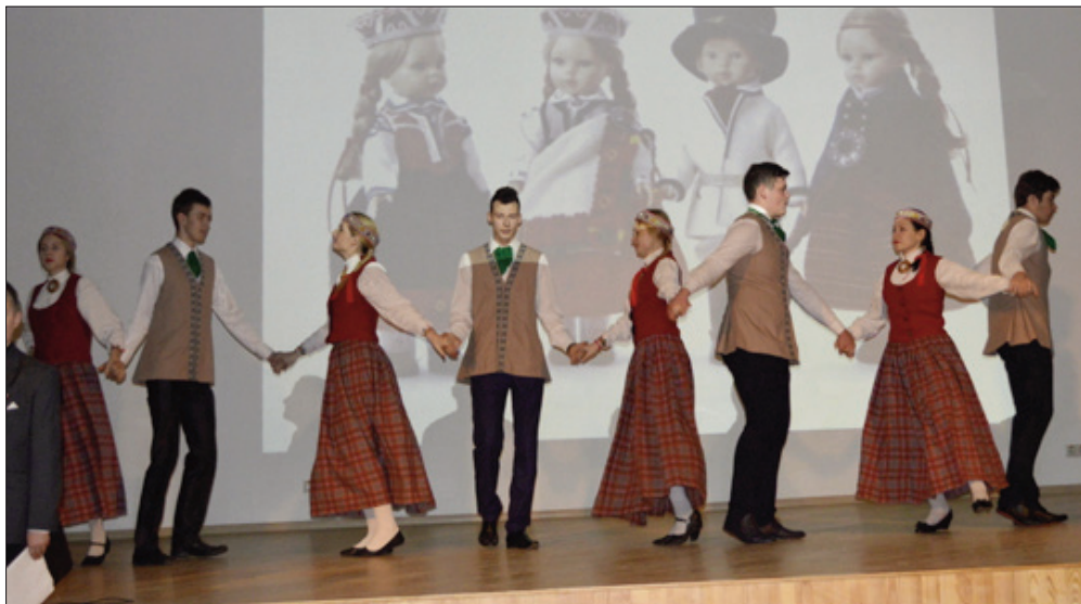
■ Deja Līvānu 2.vidusskolas audzēkņu izpildījumā.

► Ināra Bojāre, Līvānu 2.vidusskolas bibliotekāre