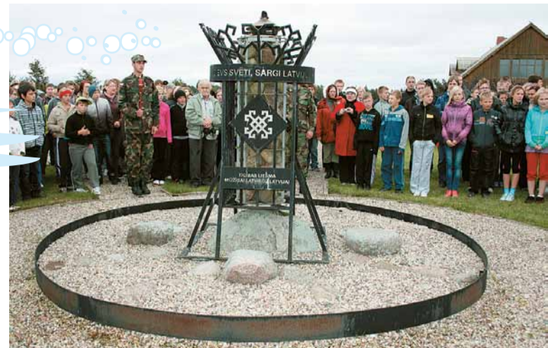
Septembrī Ošupes pagastā O.Kalpaka dzimtajās mājās notika kārtējie Karoga svētki.