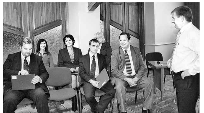
Pavasārī Madonas novada pašvaldības vadība un deputāti devās uz pagastiem, lai tiktos ar pārvalžu vadītājiem un iedzīvotājiem.

Madonas novada pašvaldības Attīstības nodaļas vārdā – INESE SOLOZEMNIECE