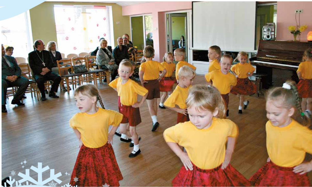
Šogad pie rekonstruētām telpām un labiekārtotiem spēļu laukumiņiem tikuši arī Madonas pirmsskolas izglītības iestādes „Priedīte” mazie iemītnieki.

Kā allaž izglītības iestāžu un pedagogu darbs tiek nopietni izvērtēts gan skolu pašvērtēšanas procesā, gan skolu akreditācijās, un ļoti patīkami,