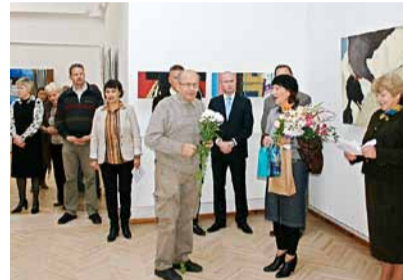
Madonas muzejā tika atklāta Vaijies sadarbības partneru gleznu izstāde.