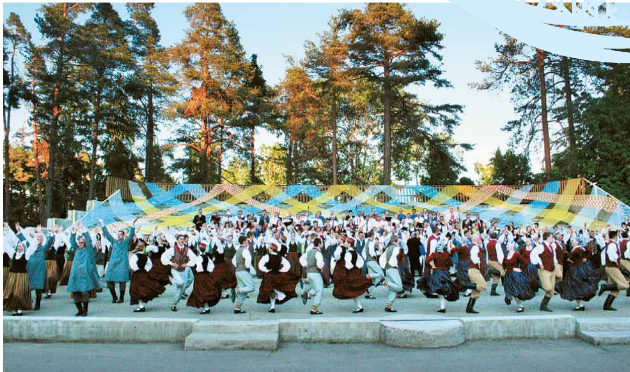
Šovasar novada dejotāji un dziedātāji pulcējās lielkoncertā par godu Madonas 85 gadu jubilejai.