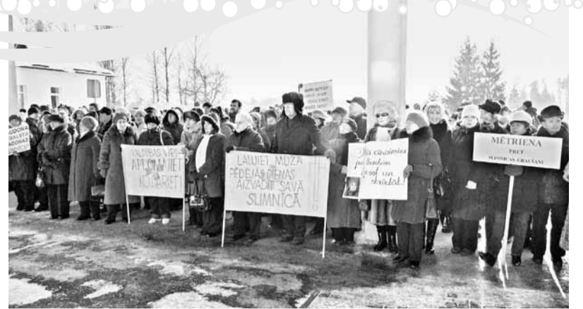
Februārī novada iedzīvotāji izteica savu viedokli pret Madonas slimnīcas slēgšanu vērienīgā pikētā.