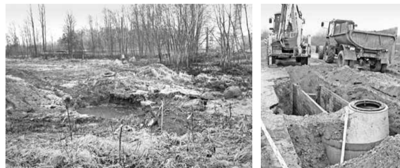
no projekta īstenošanas vietas