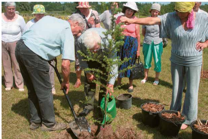
Vestienas pensionāri iedēstījuši savu koku Likteņdārzā.