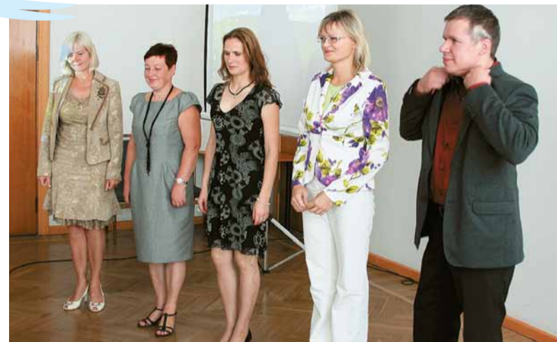
Nebijis gadījums Madonas izglītības sistēmas vēsturē – jauno mācību gadu vienlaikus sāka seši jauni skolu vadītāji!

Prieks un gandarījums par paveikto ir neatņemama izglītības iestāžu ikdienas darba sastāvdaļa, kas rosina arvien jaunām idejām, aktivitātēm, sasniegumiem. Galvenais izglītības iestādes darba kvalitātes apliecinājums ir labi skolēnu mācību rezultāti. Īpaši lepojamies ar Madonas Valsts ģimnāzijas sasniegumiem Draudzīgā Aicinājuma skolu reitingā, kas balstīts uz centralizēto eksāmenu