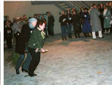
Oktobrī lustīgā noskaņā Madonas kultūras nams atzīmēja 75. dzimšanas dienu.