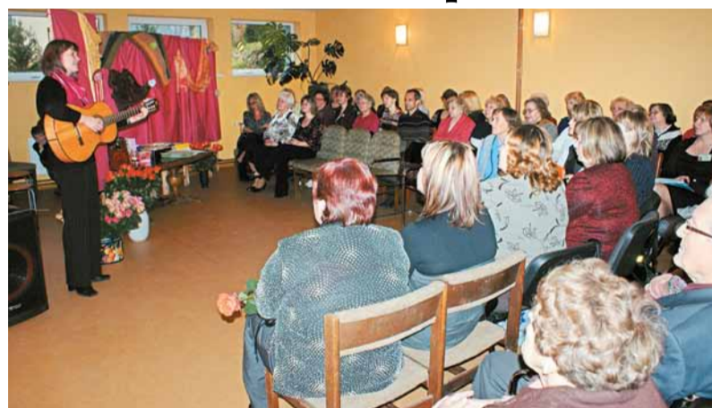
Klātesošos priecēja muzikāli priekšnesumi.