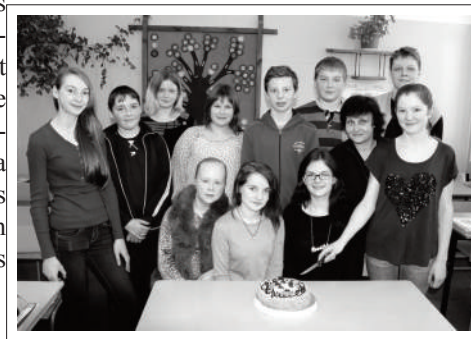
8. klase kopā ar audzinātāju.

Teksts, foto: Imants Slišāns, Baltinavas vidusskolas direktors