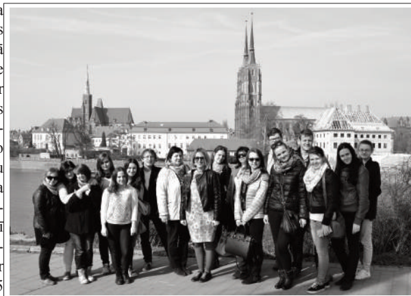
Ekskursija pa Vroclavu - latvieši un poļi kopā.

Šo braucienam kopumā vērtējam kā neapraķstāmu – vēl ilgi pēc tam, kad atbraucām mājās, nespējam valdīt emocijas par piedzīvoto. Lai arī ceļa tika pavadīts daudz laika un nobraukti vairāk kā 3000 km, šķiet, ka kopā pavadītais laiks līcis mums visiem sadraudzēties vēl vairāk, iepazītināt viens otru, jokojam un pavadījām