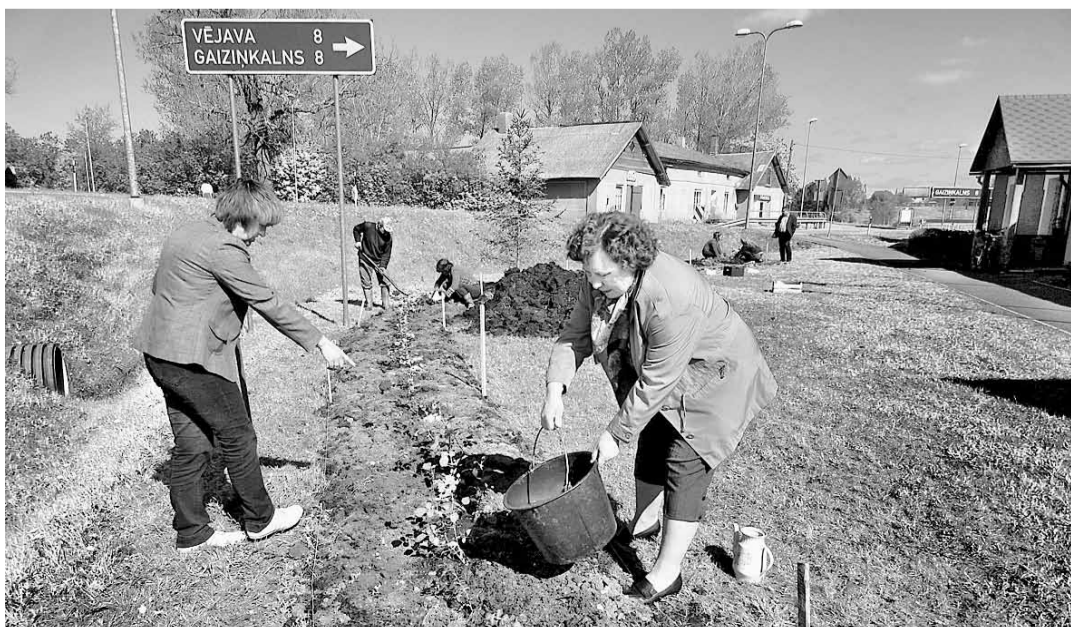
Pusceļā uz Gaiziņu kopīgiem spēkiem top rožu stādījumi.