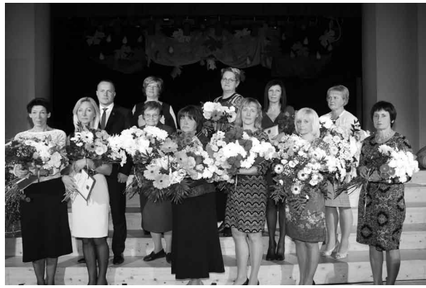
Nominācijas “Sasniegumi mācību darbā” laureātes