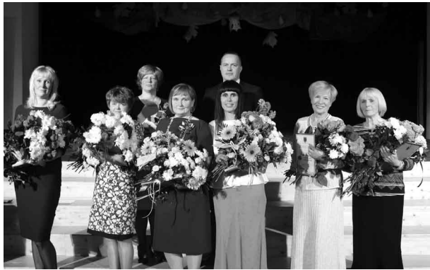
Nominācijas “Izglītības iestāžu vadīšanā” un “Audzināšanas darbs” laureātes