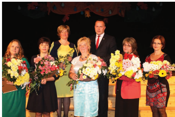
Nominācijas "Radošums un inovācijas" laureātes

Smiltenes novada domes konkursa "Par sasniegumiem izglītībā" mērķis ir stiprināt pedagoga profesijas prestižu, atpazīstamību sabiedrībā un motivēt pedagogus radošam darbam. Konkursa laureātus apbalvo nominācijās par sasniegumiem mācību un audzināšanas darbā, radošumā un inovācijās, un izglītības iestādes vadīšanā. Konkurss tiek rīkots jau trešo gadu, un laureātiem skolotājiem veltītajā svinīgajā pasākumā pasniedz Smiltenes novada domes pateicības rakstus un naudas balvas.