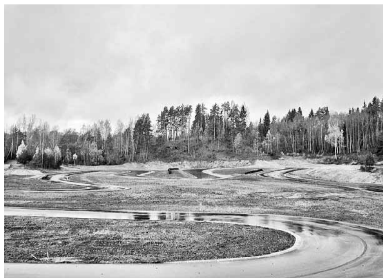
Madonas kartinga trase. 2012. gada oktobris.

2012. gada septembrī ir pabeigta Eiropas lauksaimniecības fonda lauku attīstībai līdzfinansētā projekta „Madonas kartinga trases jaunbūve” ieviešana, kā rezultātā Madonā Gaujas ielā esošā kartinga trase ir rekonstruēta un izbūvēti jauni trases posmi.