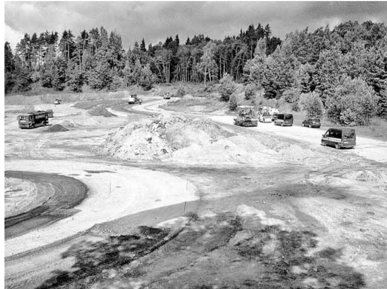
Rit būvdarbi. 2012. gada augusts.