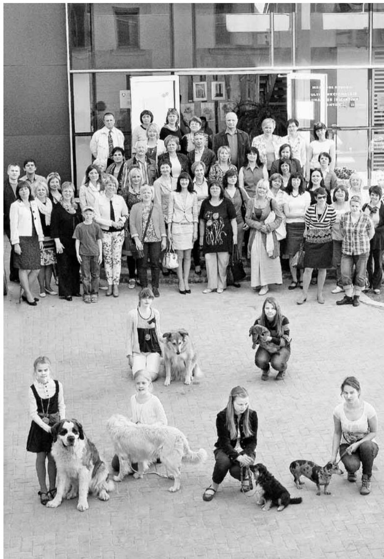
Sabraukušos direktorus sajūsmināja pulciņa „Mācīsimies kopā ar mājdzīvniekiem” dalībnieki ar saviem mīļiem.

Līdz ar pirmo pavasara zaļumu un siltajiem saules stariem Madonas novadā īpašu sajūsmu semināra dalībnieki