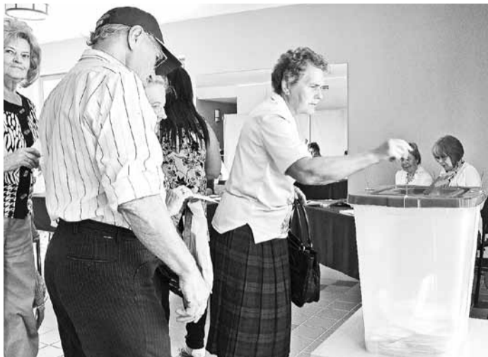
Madonas novada vēlēšanu dienā darbojas 18 iecirkņi.

„Karalis ir miris. Lai dzīvo karalis!” mēdzot saukt monarhijās dzīvojošie ļaudis. Latvijā vēlētas varas maiņa pašvaldībās notiek reizi četros gados – vieni aiziet, nākamie stājas vietā.