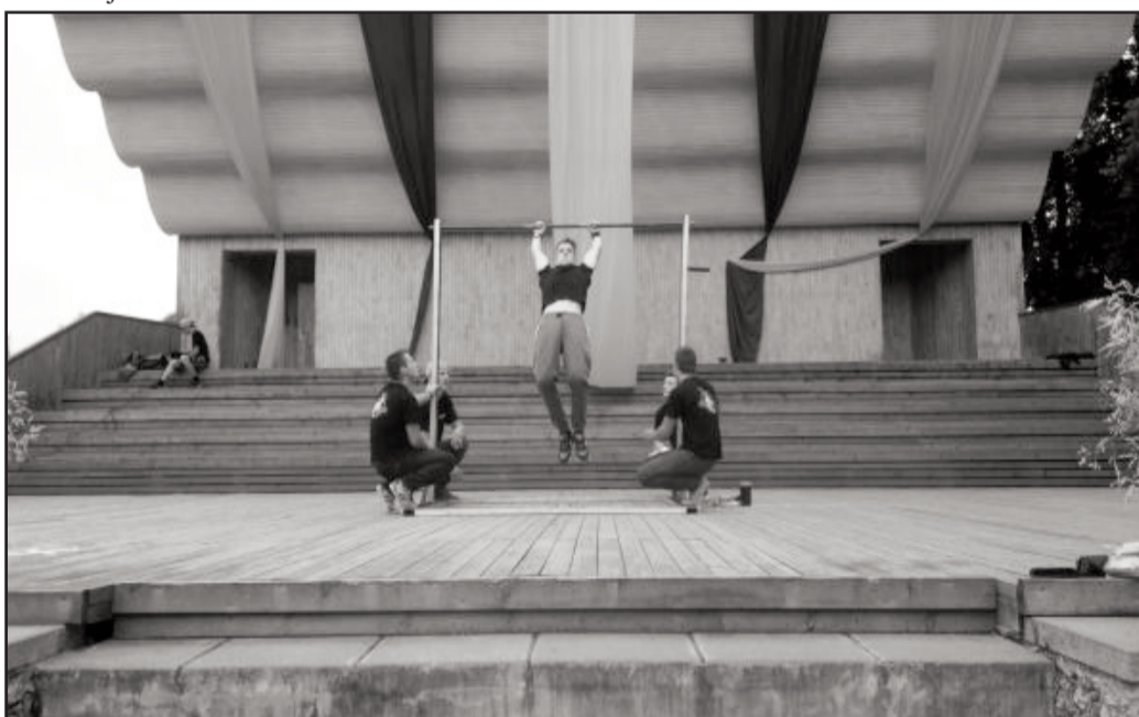
Uzstājas Briežuciema ielu vingrotāju grupa "Extreme"