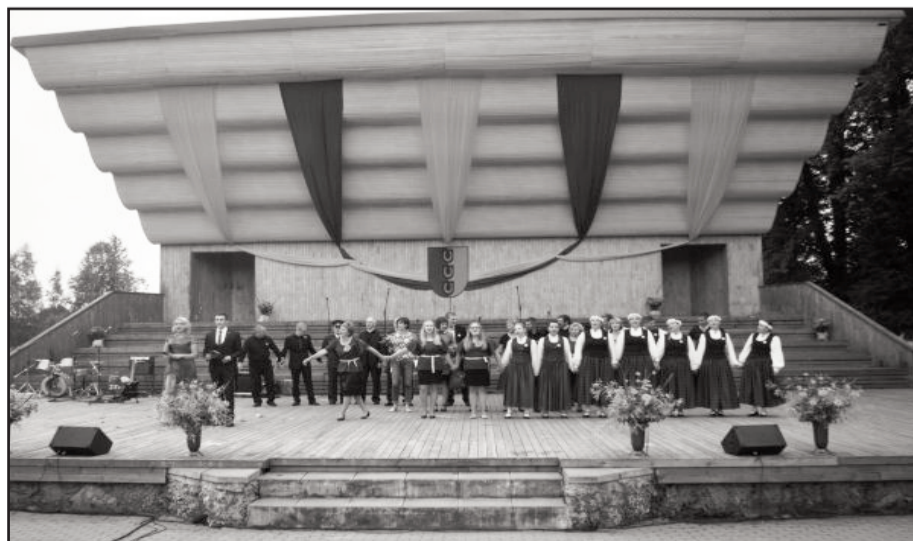
Svētku noslēgumā izskan Baltinavas Himna.