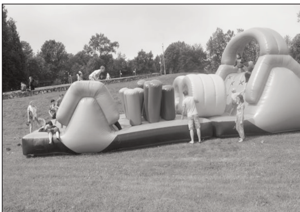
Novada svētku dienā Baltinavas parka estrādes teritorijā bija pieejamas piepūšamās atrakcijas.