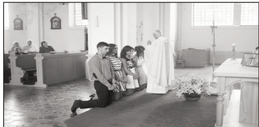
Pilngadnieki saņem svētību Svētku misas laikā