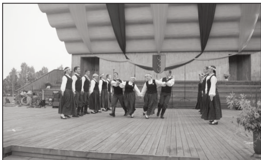
Baltinavas jauniešu deju kolektīvs "Kustikust"