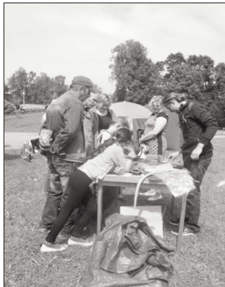
Adas apstrādes meistardarbnīca