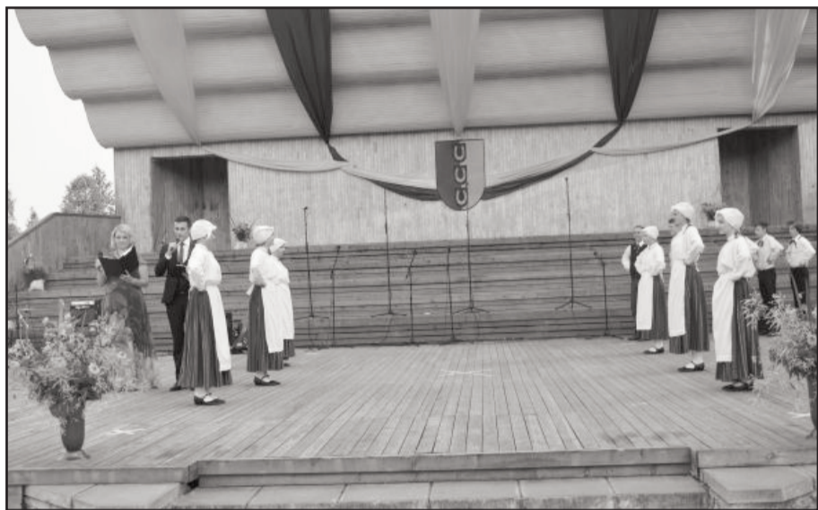
Baltinavas novada jauniešu deju kolektīvs