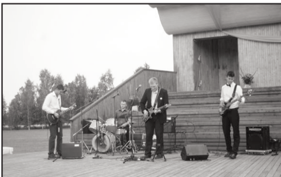
Grupa "Unknown Artist"