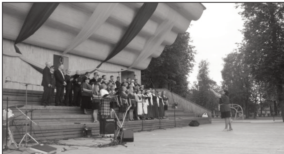
Uzstājas Baltinavas novada jauktais koris