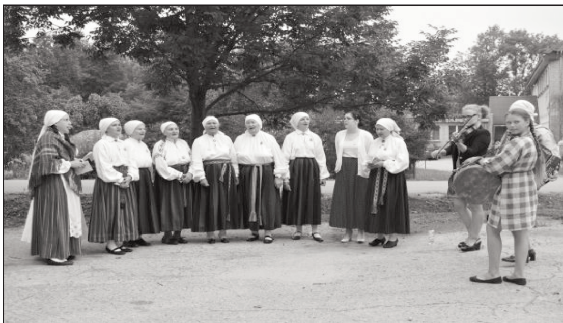
Vietējo lauku labumu tirdziņā uzstājas Baltinavas etnogrāfiskais ansamblis