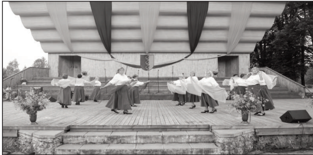
Uzstājas Baltinavas novada sieviešu deju kopa "Gaspāža"