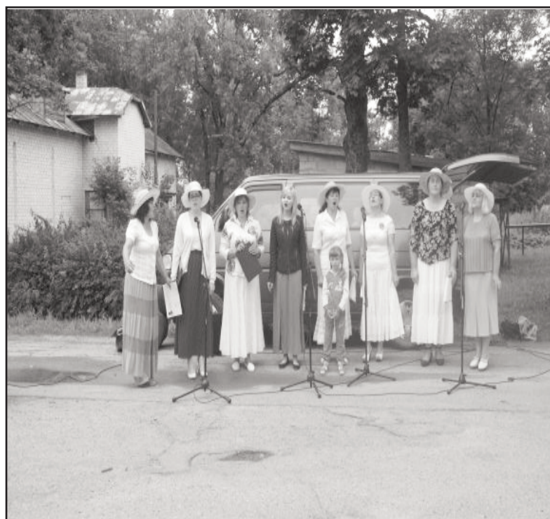
Uzstājas Baltinavas sieviešu vokālais ansamblis