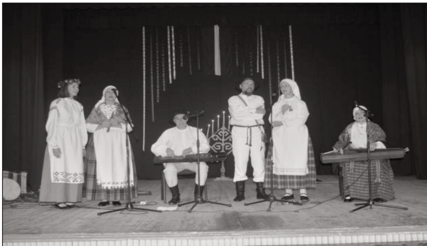
Teksts, Foto: Evita Broka