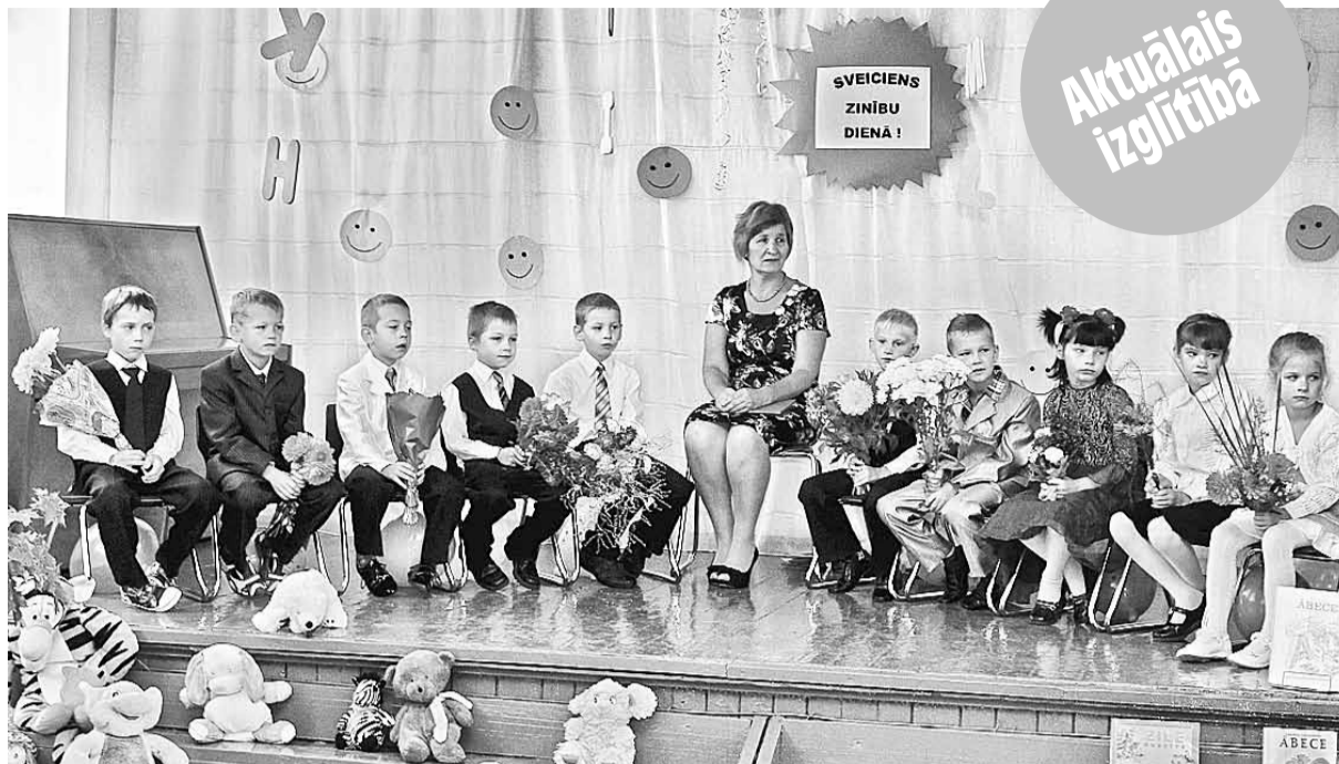
Mārcienas pamatskolas pirmā klase Zinību dienā.

Ar š.g. 1. septembri ir paaugstināta MK noteiktā zemā-