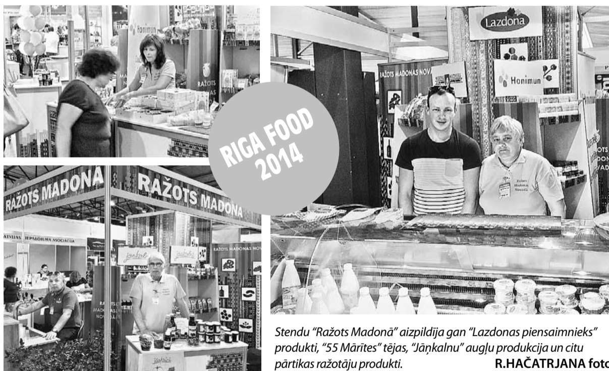
Stendu "Ražots Madonā" aizpildīja gan "Lazdonas piensaimnieks" produkti, "55 Mārites" tējas, "Jāņkalnu" augļu produkcija un citu pārtikas ražotāju produkti.

Madonas novadu šogad pārstāvēja AS "Lazdonas piensaimnieks" – uzņēmums iepazīstināja sadarbības partnerus un izstādes apmeklētājus ar savu jauno produkciju – bioloģisko kefīru un sieru. "Madonas maiznieks" izstādē saņēma 3 godalgas par izcilas garšas maizi un ļāva pierādīt arī novērtēt šo maizi. Inovatīvu produktu – vitamīnu kapsulas enerģijai un imuni-