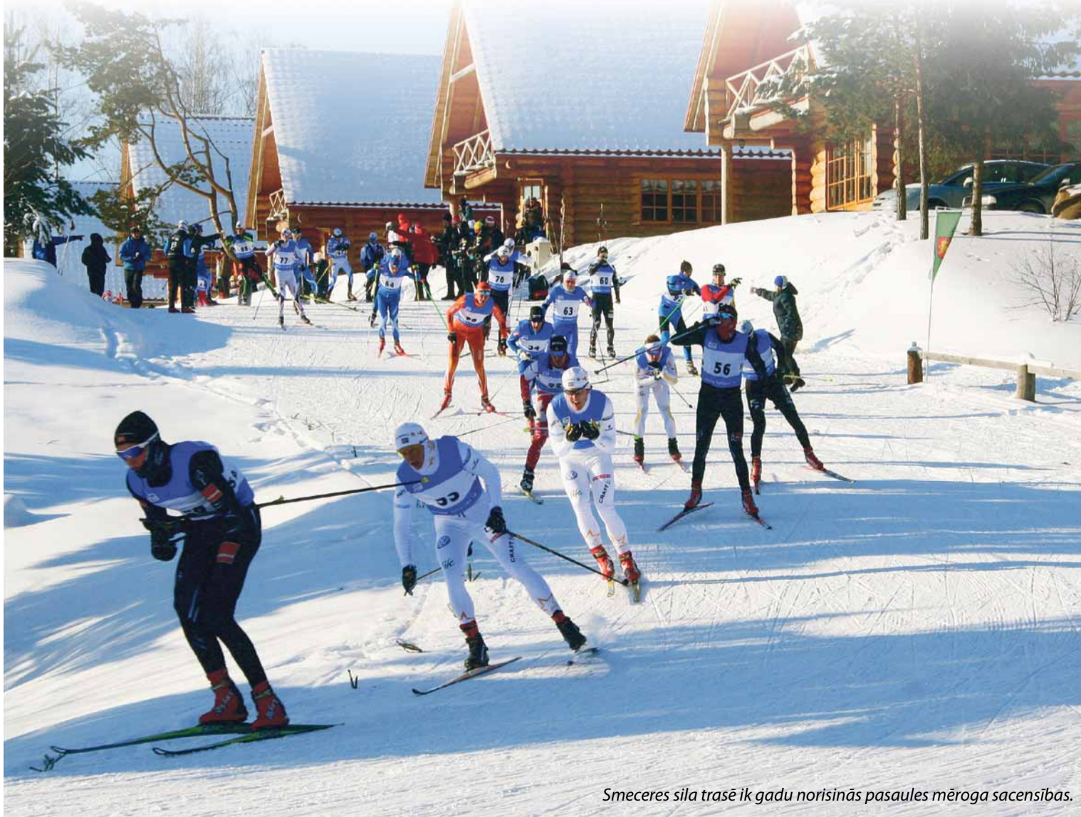
Smeceres sila trasē ik gadu norisinās pasaules mēroga sacensības.