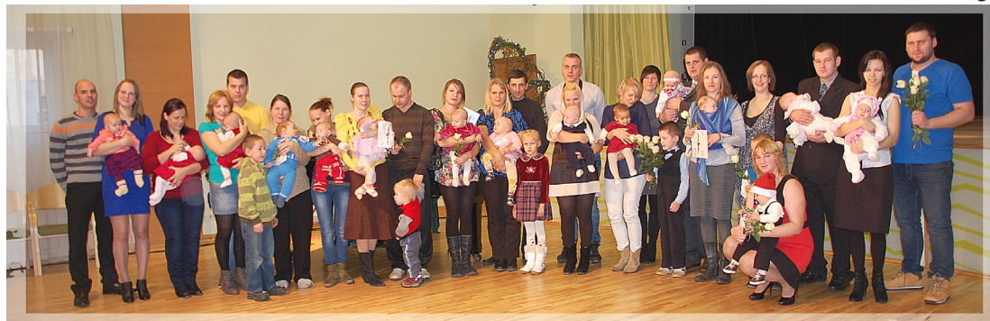
Informāciju sagatavoja Mazsalacas novada Dzimtsarakstu nodaļas vadītāja Anna Penka

2013. gadā Mazsalacas novadā ir laulājušies 7 pāri, un viens pāris no tiem reģistrējuši laulības Mazsalacas Sv. Annas evaņģēliski luteriskajā draudzē. Un aizvadītajā gadā reģistrēti 54 miršanas gadījumi.