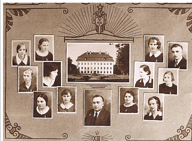
Mazsalacas vidusskolas 13. izlaidums 1936. gadā