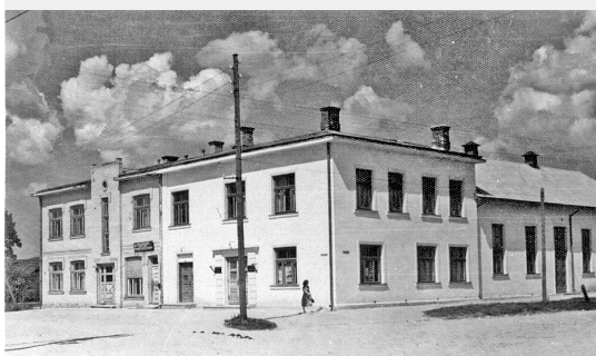
Mazsalacas Kultūras namam - centram ap 1960. gadu

Vēlams par savu ierašanos paziņot personīgi Kultūras centrā, vai pa tālruni 64251203 vai 29179179. Pasākuma omulībai lūdzu līdzī sarūpēt groziņu.