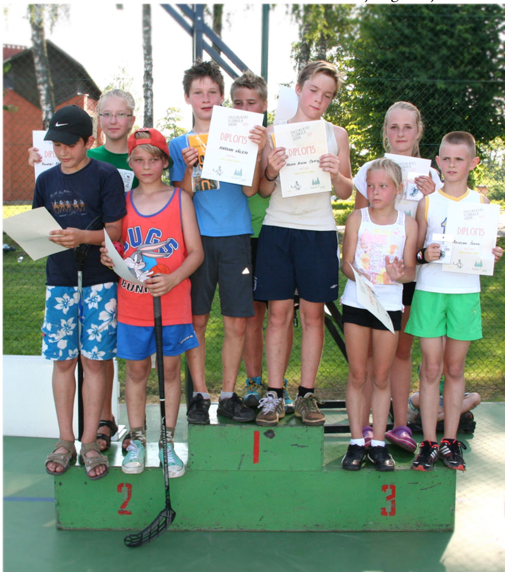
Komandu vecumā līdz 14 gadiem pirmo trīs vietu ieguvēji: I vietā „Ir, ir -nav, nav”, II vietā „Mazuliši”, III vietā „Radinieki”