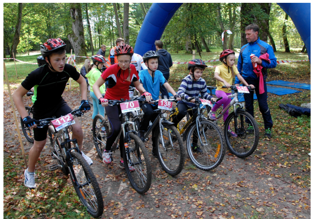
Uz starta B3 grupas jaunieši