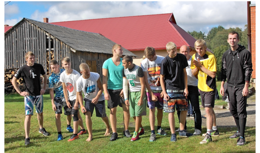
Krosiņam gatavojas ātrākie skrējēji