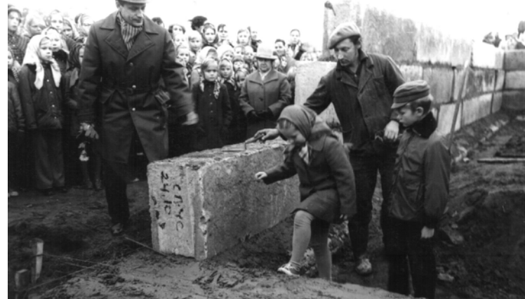
Jaunās skolas pirmā pamatakmens ielikšanas svinīgais pasākums 1975. gada 15. oktobrī.