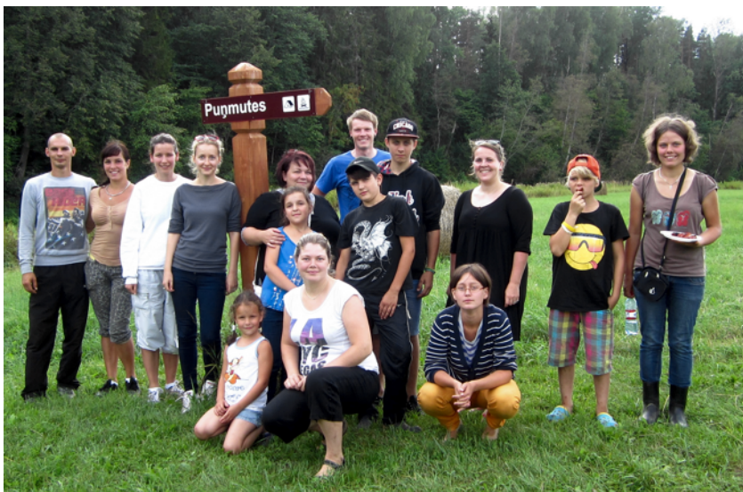
Čaklie talcinieki - Salacas tīrītāji