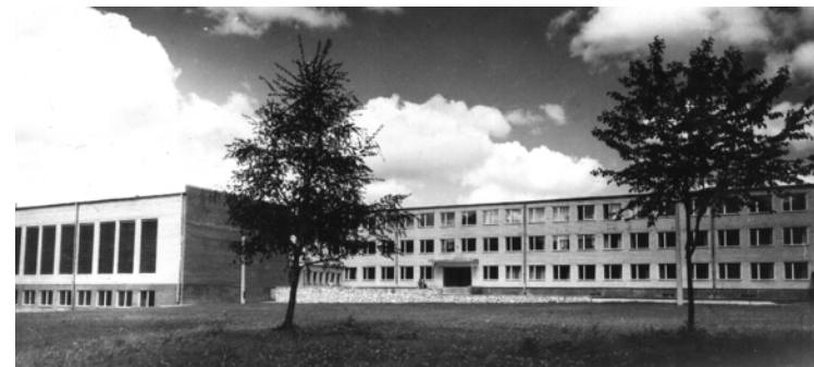
Mazsalacas vidusskolas jaunā ēka (1976. gads)