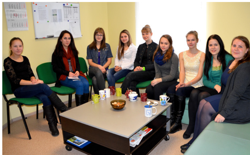
Šīs 8. klases meitenes izvēlējās “ēnot” pašvaldības darbiniekus