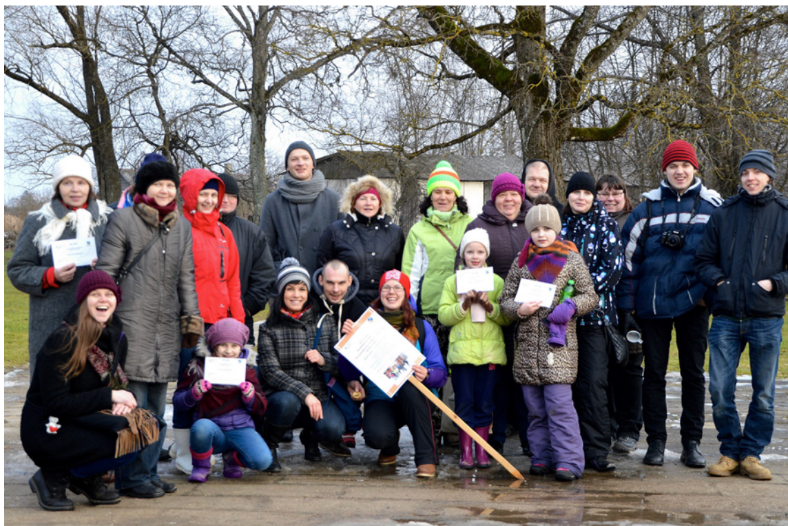
Starptautiskās gidu dienas izturīgākie dalībnieki un organizatori: biedrība "Jauniešu vētra" un Mazsalacas TIC.

Organizatori pauž gandarījumu par paveikto un uzskata, ka Starptautiskās gidu dienas atzīmēšana dažādos formātos varētu kļūt par jauku tradīciju Mazsalacas pusē. "Tas mudinātu vietējos vēstures zinātniekus dalīties ar savām zināšanām, vēstures stāstiem, kas savukārt veicinās Mazsalacas