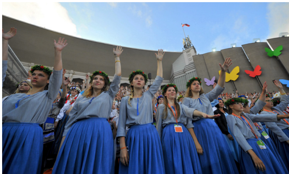
MEITEŅU KORIS "SONĀTE" MEŽPARKA LIELAJĀ ESTRĀDĒ.