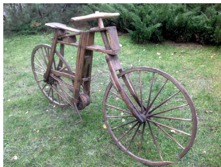
TEŅA NUĶA IZGATAVOTAIS KOKA VELOSIPĒDS