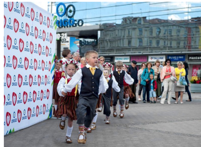
"KAMOLĪTIS" UZSTĀJAS LAUKUMĀ PIE T/C "ORIGO", RĪGĀ.