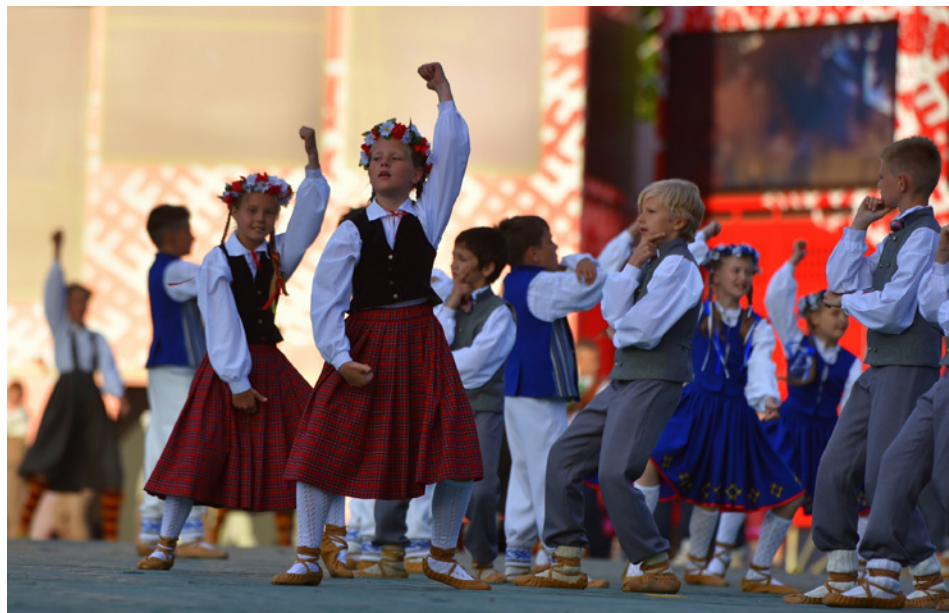
DAUGAVAS STADIONĀ. DEJU KOLEKTĪVS "ĶIPARI" A GRUPA.

- Gods un milzīga laime būt latvieti Latvijā, piedzīvot šo spēku un brīnumu!