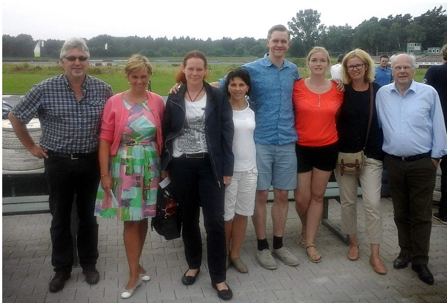
VIZĪTĒ HARZEVINKELĒ, PIE KARTINGA TRASES, KOPĀ AR SADRAUDZĪBAS PARTNERIEM.