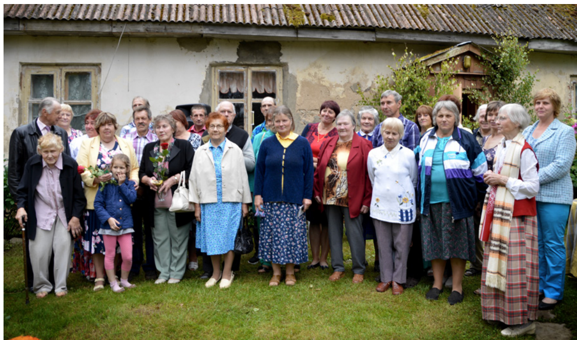
SĒĻU SKOLAS SALIDOJUMĀ: BIJUŠIE ABSOLVENTI UN SALIDOJUMA VIESI.

Saldējums un citas izklaides zemniekbērnu modē