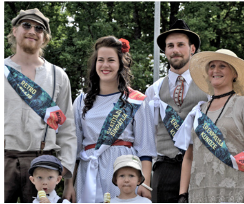
ŠĪ GADA SUMINĀTIE VELOPARĀDĒ "ĒRENPREISAM 124"

Šogad skatītāju acis velosvētkos priecēja ar ziediem rotāti velosipēdi, elegantas dāmas krāšņās kleitās un zolīdi tērpušies kungi rūtainos kreklos, štrumbantēs, ar tauriņiem un hūtēm. Velo parādē piedalījās 172 dalībnieki. "Ērenpreiss 124" dalībniekus žūrija vērtēja vairākās nominācijās. Titulu "Ērenpreisa