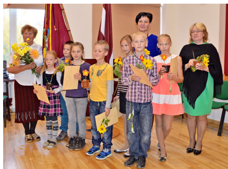
MAZSALACAS VIDUSSKOLAS MAZPULKA DALĪBNIKI PĒC SVINĪGĀ SOLĪJUMA DOŠANAS

Kārlis Ulmanis emigrācijā pavadītajā laikā Amerikā iedvesmojās idejai, ka arī Latvijā jaunatnei vajadzīga īpaša organizācija, kas veltītu plašāku uzmanību lauksaimniecībai un sabiedriskās dzīves izkopšanai. Viņš sāka par to rakstīt