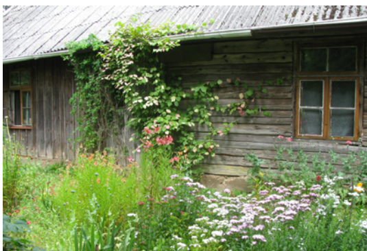
“DZELMES” SĒLU PAGASTS