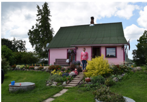
“RIJASKALNI” RAMATAS PAGASTS

Atzinība: “Saktas” Olga Vilkaplatere, ”Griezes”, Ilze Ķemme