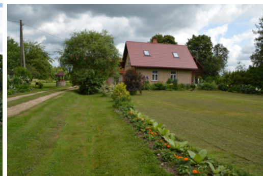
“CERIŅI” SKAŅKALNES PAGASTS