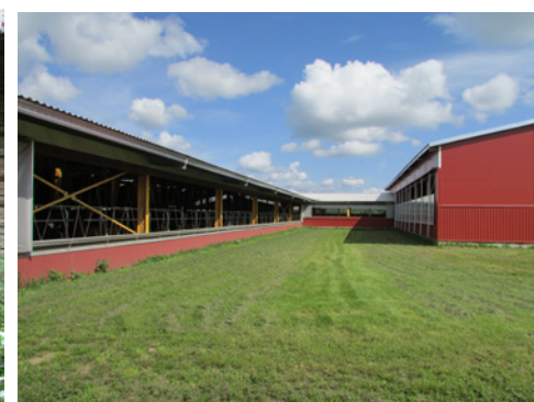
“KALNABLĀĶI” MAZSALACAS PAGASTS