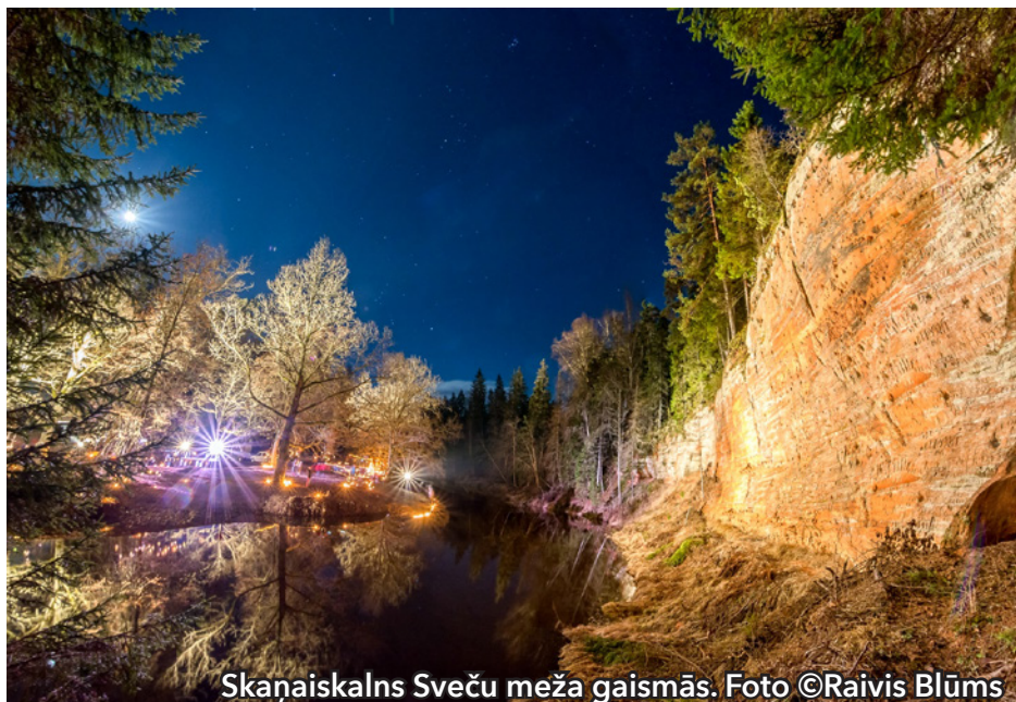
Skaņākalns Sveču meža gaismās.