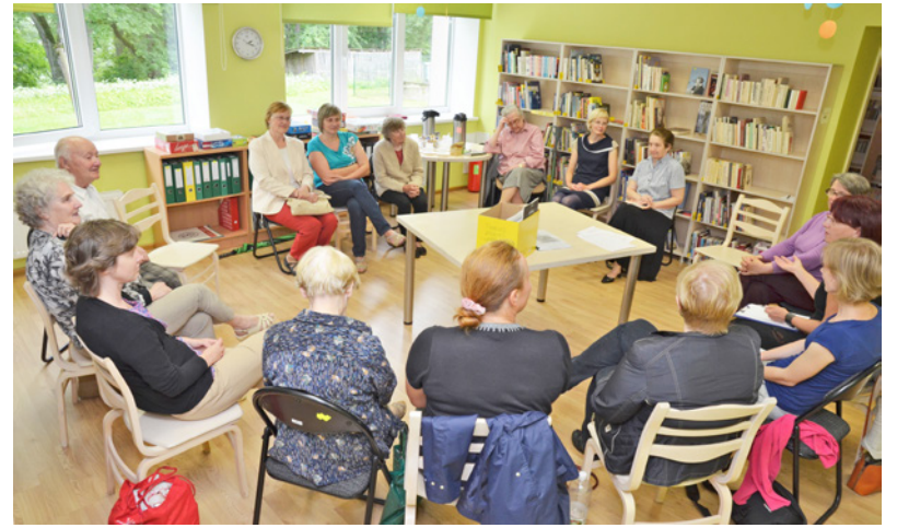
Stāstnieku tikšanās Mazsalacas pilsētas bibliotēkā.

Gada laikā bibliotēkas krājums papildināts par 723 eksemplāriem, no kuriem 596 eksemplāri iegādāti par pašvaldības piešķirtajiem līdzekļiem, bet 127 eksemplāri saņemti kā dāvinājumi. Visvairāk dāvinājumi