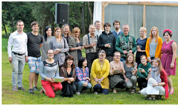
PASĀKUMA “PILIENS DABAS” PALĪGI.