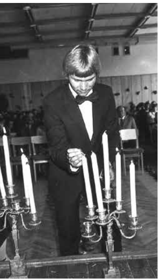
Beidzot Pilsrundāles vidusskolu.