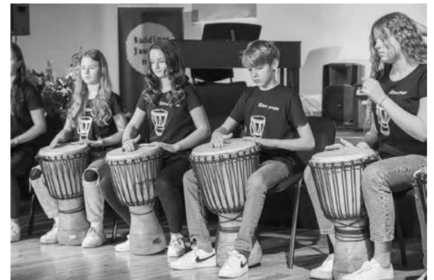
Kuldīgas novada bērnu un jauniešu centra džambas ansamblis.

Uzstājušies 12 kolektīvu no mūsu novada un pārstāvji no Ventspils, Liepājas, Aizputes, Engures, Valdemārpils, Tukuma, Kandavas un Talsiem. Visi mūsējie saņēmuši 1. pakāpes diplomu. Augstāko rezultātu ieguvuši kolektīvi no Liepājas Mūzikas, mākslas un dizaina vidusskolas, Ventspils kultūras centra un jaunrades nama, Talsu Kristīgās vidusskolas un bērnu un jauniešu centra.