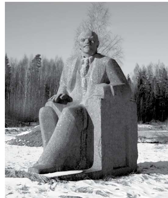
Ar Bauskas pieminekļa atvešanu bijuši vairāku dienu piedzīvojumi. Tas vests ar diviem 50 tonnu ceļamkrāniem.

Kuldīgas Ļeņinekļi ir pirmais, ko M.Mētelis jau izjauktu atradis elektriķu kantorī. Kad atvests, kādu laiku stāvējis nemontēts. Interesi izrādījusi Latvijas