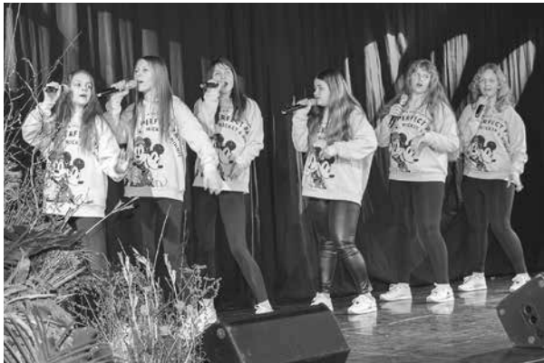
Kuldīgas novada bērnu un jauniešu centra popgrupas Putas jaunākā grupa.

Kurzemes vokāli instrumentālo, instrumentālo ansambļu un popgrupu konkursa No baroka līdz rokam otrajā kārtā Kuldīgā piedalījušies pāri par 200 jauno mūziķu vairāk nekā 40 kolektīvos.