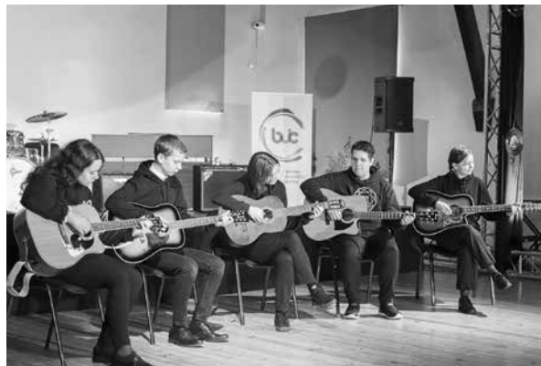
Kuldīgas novada bērnu un jauniešu centra ģitārspēles pulciņš.