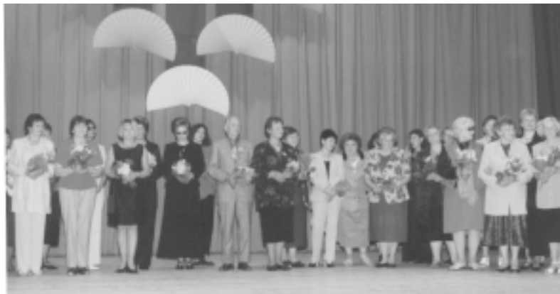
Skolotāji koncerta noslēgumā.

Esam pierakstījuši arī vairākus interesantus priekšlikumus, ko varētu