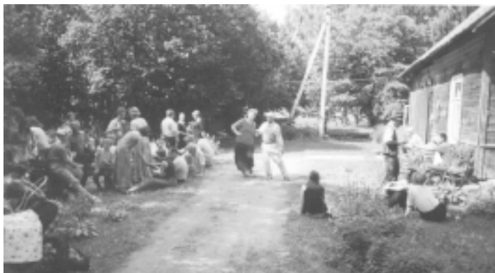
Jāņu dienas gājiena dalībnieki kādā no kaimiņmājām.

Uz rīta pusi, kad saulīte jau rotājas, bet izturīgākie Jāņu bērni vēl tikai domā atpūtināt sāpošās kājas un sakarsušās galvas, tik ilgām saimnieki jau