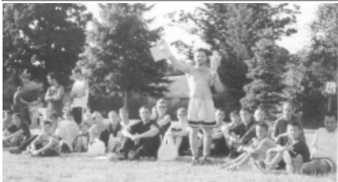
4. cehs – visu gadu aktīvākie sportisti.