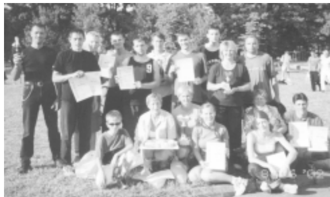
Šī gada uzvarētāji.