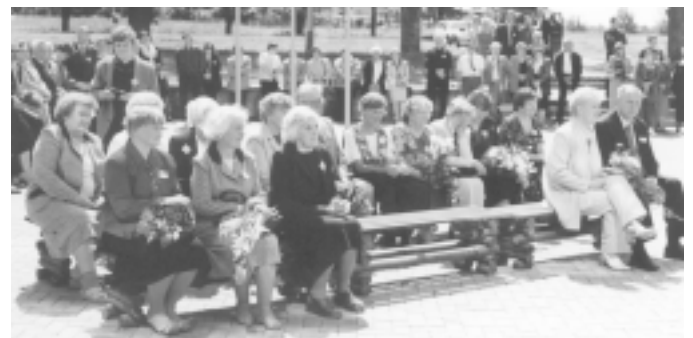
Salidojuma atklāšana pie Mālpils vidusskolas.

Kas palicis? Izrādās, ka daudz. Pirmkārt – tikšanās prieks, īpaši ar skolotājiem un absolventiem, kuru nebija iepriekšējā salidojumā un sen nav sastapti. Gandarījums par tiem, kuri pārvarējuši gan ceļa, gan dažādas citas