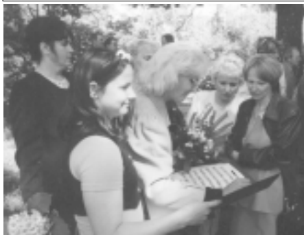
Tikšanās pie vecās skolas. Absolventi parakstās "Lielās Pūces grāmata".

gan lielajā cieņā pret savu bijušo skolu, gan sāpē par tās sūro likteni. Bet bija arī tādi, kas teica: "Kas man pazudis baznīcā? Kas tur to veco graustu ko skatīties? Kam man koncerts?" Uzdrošinot apgalvot, ka šie absolventi salidojuma garu nemaz neizjuta, acīmredzot ir pazaudējuši kaut ko ļoti būtisku – labestīgu skatījumu uz dzīvi un cilvēkiem.