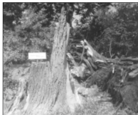
Pie Skulmju mājām vētras nolauzta zinātnieces Lidijas Liepiņas vārdā nosaukta liepa.