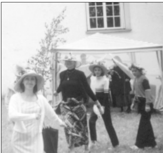
Dārza svētku dalībnieki braši iesaistās spēlēs un rotaļās.