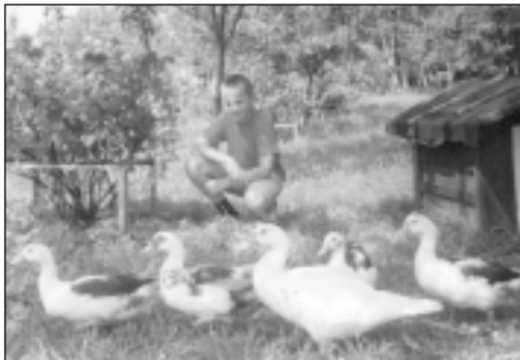
Maira piļu saime.

- Man šķiet, ka jums visiem te iznāk krietni ko noņemties?