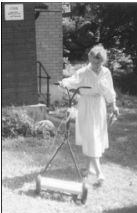
Tiek izmēģināts jaunais zāles plāvējs.