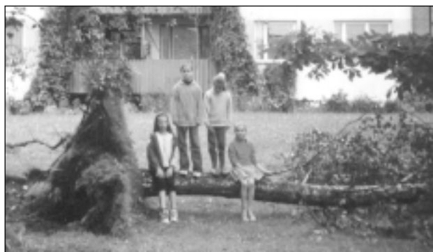
Izgāztais bērzs Celtnieku un Kastaņu ielas pagalmā.