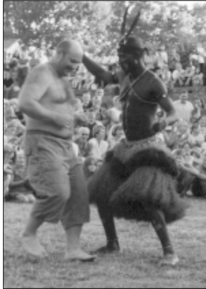
Ar āfrikāņu dejojātāju izturībā mērojās kāds vīrs no publikas.