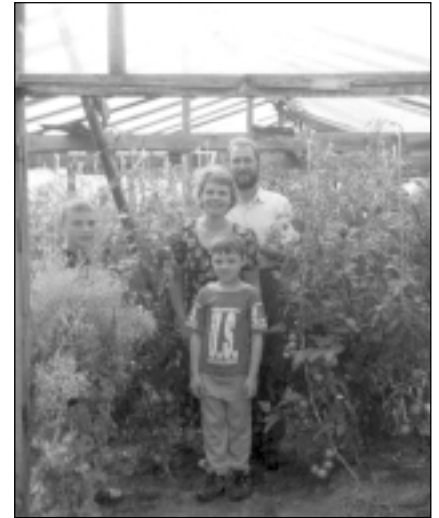
Tomāti siltumnīcā jau izauguši lieli un priecē ar savu ražu.