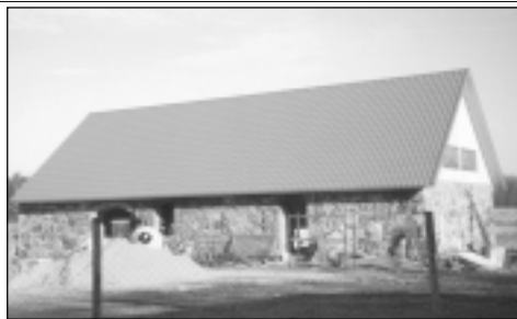
Laikā, kad darbnīca vēl tapa.

Pēc atmodas laikā, kad atklāti sāka runāt par Sibīrijas šausmām, izlasīju par Gulagu un jutos kā piesmieta, ap-