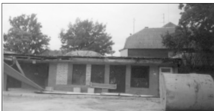
Tāda izskatījās Mālpils autoosta pēc kārtējās demolēšanas.

Apsardzei ir tiesības šos pusaudžus aizturēt, kamēr vecāki atnāk pakaļ un