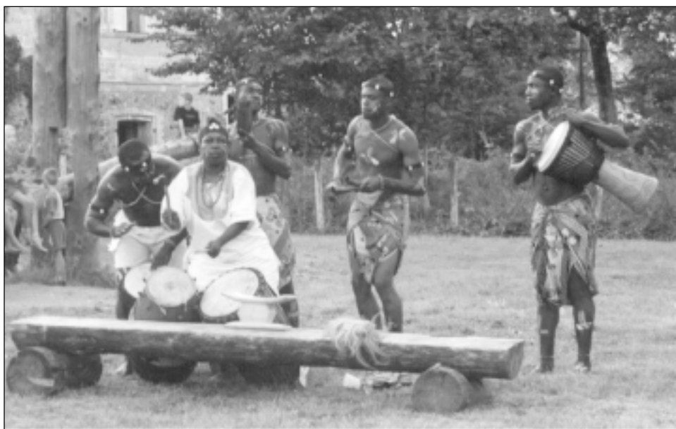
Koncertē rituālo deju grupa no Rietumāfrikas.