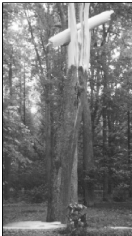
Vētras "meistardarbs" Mālpils parkā.

Dabas stihijā visbiežāk cieš koki. Šovasar to bijis sevišķi daudz. Mālpils pašvaldība apsekoja kokus savā valdījumā esošajos nekustamajos īpašumos: "Mālpils parks", "Mālpils kapi", "Torņkalna kapi", "Mālpils estrāde", "Doktorāts" un konstatēja, ka vētras un citu dabisko procesu rezultātā ir izzāģējami koki: