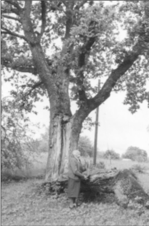
Pie dzimtas ozola, kuru ieriekšējā vasarā skārusi viesuļvētra.

saukums ir "Vasaras un dziesmu vainagā". Adījumu iecerēju veidot pakāpeniski – kā vasara zied, kā viņa aiziet. Tad pienāk dziesmu laiks. Saules raksts. Tā kā vainagi visapkārt, saulainā krāsā. Aizvien pakāpeniskāk zaļums tāds gaišs pārīet uz baltu, tad zaļie vainagi. Vēl pa vidu iespīdas košāka Jāņuguns.