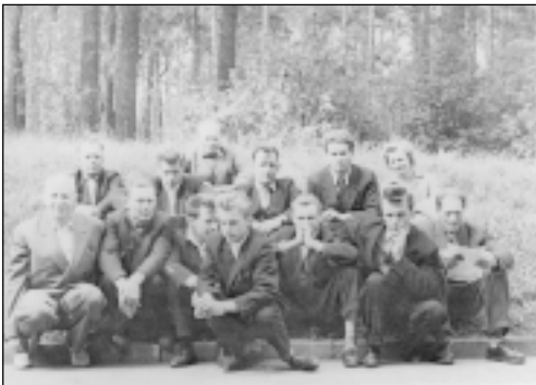
Pieredzes apmaiņas ekskursijā.