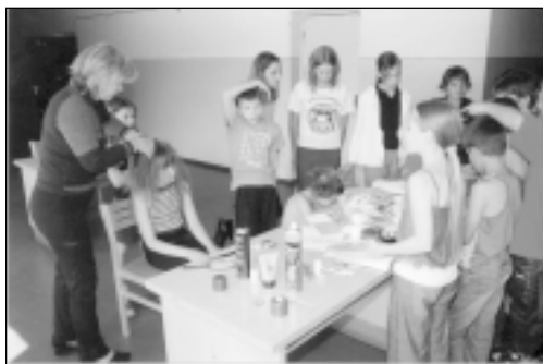
6.jūnijā visa mūsu uzmanība veltīta bērniem. No rīta gan mazie, gan lielie devās iepazīt mūsu pagastu, vienlaikus meklējot aplēpto mantu, kas atrodas Mālpils pilskalnā. Bet pēcpusdienā bērni varēja izpaust savus talantus un izbaudīt kaut ko neparastu meistardarbībā, piemēram, jaunas un ekstravagantas frizūras (tām bija vislielākā piekrišana)...