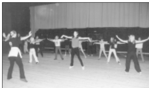
...vai iemācīties kādu deju kopā ar estrādes deju grupu "Amulets". Bija arī videošana, gleznošana, teātra spēlēšana, dziedāšana un kosmētikas apgušana.