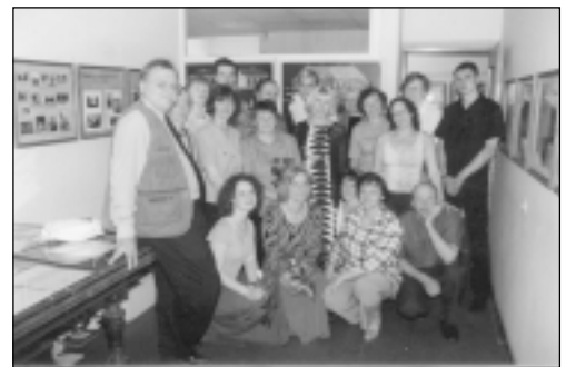
Jaunizveidotais Mālpils Novadpētniecības muzejs jau kopš 5.jūnija aicina ikvienu pie sevis ciemos. Te var apskatīt brīnišķīgu izstādi "Mālpils muižas vēsture", kā arī fotostāstu par Mālpils vēsturiskajām vietām. Izstādes atklāšanas dienā sanāca daudz viesu, starp tiem arī Mālpils muižas jaunā īpašnieka meita ar savu draugu.