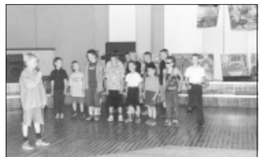
Visu, ko bērni apguvuši minētajās meistardarbībās jeb "Jauno talantu fabrikā", vajadzēja atrādīt vakara koncertā. Savu māku skatītājiem demonstrēja arī sporta dejotāji, konkursa "Mālpils Dziesma" dalībnieki, deju grupa "Amulets", kā arī mūsu viesi no Rīgas – deju grupa "Dogma".