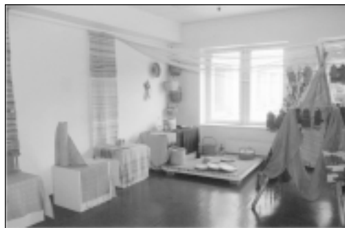
30.maijā tika atklāta Mālpils tautas lietišķās mākslas izstāde "Laika upe". Ar šo izstādi aizsākās Mālpils svētki – klusi, skaisti un radoši. Drīz pēc tam mālpilieši varēja iepazīties arī ar Vangažu amatnieku darbiem.