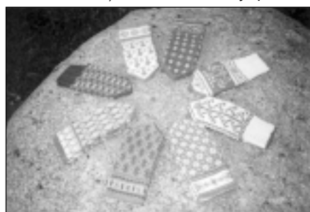
Šie cimdi no "Ievlejš" aizceļoja uz izstādi Beļģijā.

- Manus adījumus bija ievērojusi Mālpils lietišķās mākslas pulciņa vadītāja Lauma Krastiņa, kura arī rosināja piedalī-