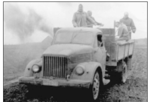
Minerālmēslu "sējmašīnas" tēlo lauku brigādes sievas.

Maija beigās, kad pavasara sēja pabeigta un bietes vēl nav jāravē, lauku brigādes ļaudis un lopkopējas brauca 2 die-