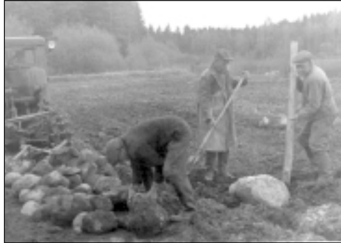
Akmeņu novākšana pēc meliorācijas.