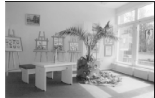
Mālpils "Parka aptieka" savas telpas atvēlēja bērnu radošo darbu izstādei "Logs". Šie skaistie mākslas darbi tika rādīti arī Latviešu biedrības namā notikušajā izstādē, kas veltīta Starptautiskajai Astmas dienai.