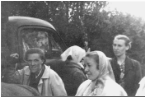
Ekskursijā Latgalē Višķu tehnikuma mācību saimniecībā 1964.gadā.

Usmas ezera krastā nakšņojām, kurinājām ugunsgrāvu, dziedājām, visu darbu