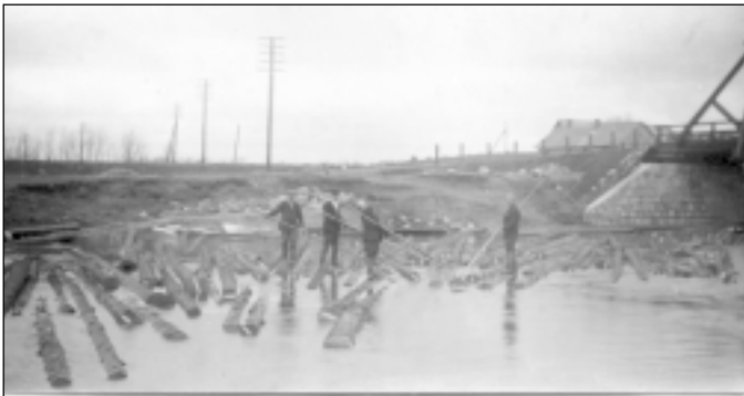
Koku pludināšana Mergupē.