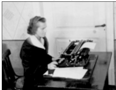
Sidgundas ciema padomē. 1959.g.

- Ja esam aizrunājušās par politiku, tad