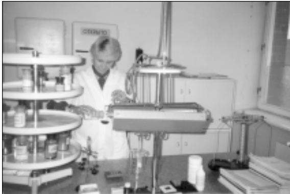
Laiku aptiekāram jāprot gan pieņemt receptūru, gan pagatavot zāles.

- Dīemžēl slimo vairāk un slimības ir arvien sarežģītākas. Agrāk bērniem retāk bija tik augstas temperatūras kā 39° un vairāk, kas ilgi nekritis. Pieaugušajiem ir daudz ielaistu slimību. Iespējams, ka to