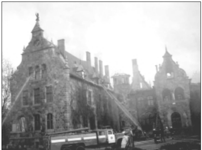
Cēsaines pils degšana.

Tomēr mūsu galvenais mērķis bija iepazīties ar tik ļoti unikālo Cēsaines pili, kas no skaldītiem laukakmeņiem celta 1894. gadā un bijusi viena no