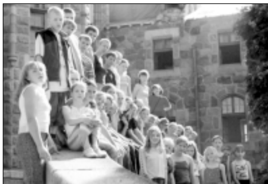
Mēs kopā ar Krimuldas mākslas skolas audzēkņiem