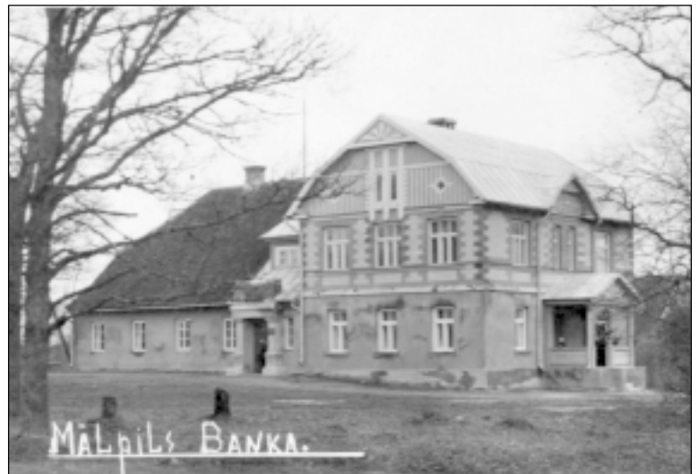
Mālpils banka, ap 1930.g. Tagad- "Vecpils".