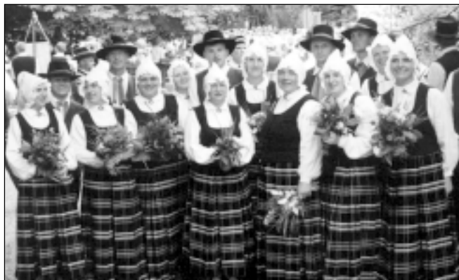
Deju kopa „Kniedīņš” svētkos piedalījās pirmo reizi. Kopā pārdzīvotā karstā saule, mirkšana lietū un gandarījums pēc labi padarīta darba, cerams „sakniedēs” deļotājus kopā uz ilgiem gadiem. Svētki pagājuši, vasara griežas uz rudens pusī un laiks gatavoties jauniem koncertiem, tāpēc 7. septembrī pulksten 17.00 uz skatuves notiks pirmais mēģinājums, uz kuru tiek aicināti arī jauni deļotāji.