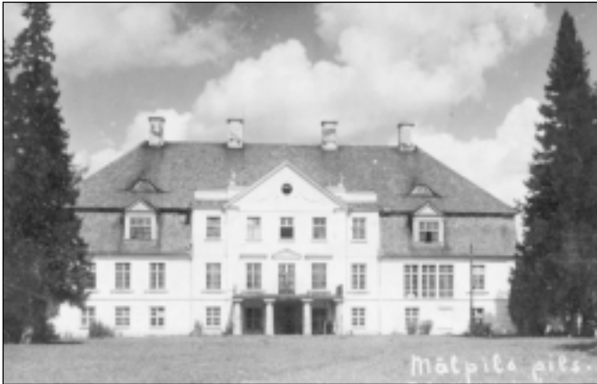
Mālpils muižas pils 1930.g.