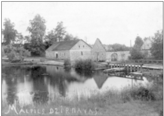
Mālpils dzirnavas, ap 1930.g.

Mālpils Novadpētniecības muzejs iekārtots Nākotnes ielā 1, pašvaldības ēkā, 226.kab. Šobrīd muzejā ir apskatāma izstāde "Mālpils muižas vēsture". Ekskursijai muzejā var iepriekš pieteikties pa tālruni 7970896.