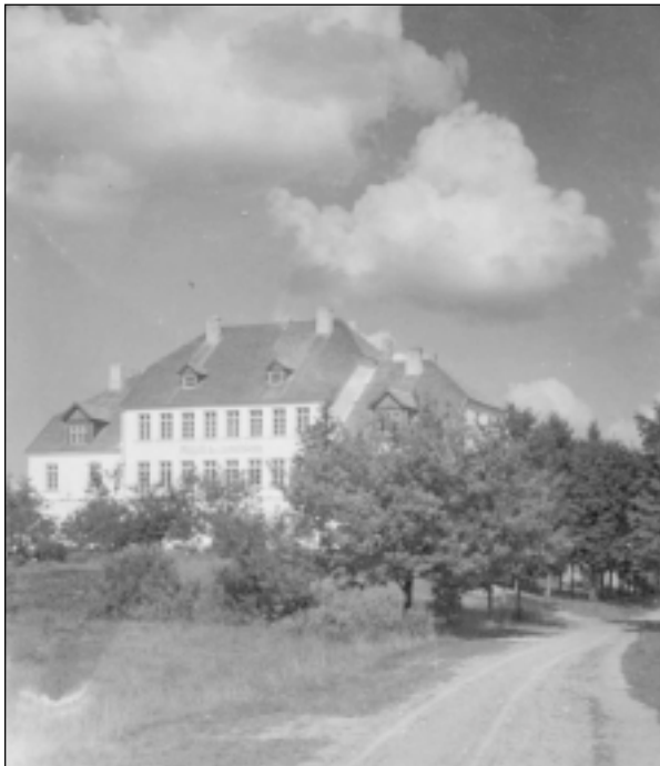
Mālpils 6-klasīgā pamatskola, ap 1930.g.