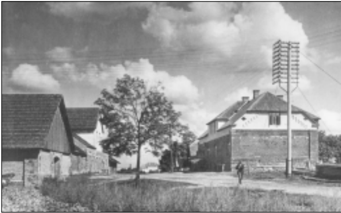
Mālpils patērētāju biedrības "Zaķa krogs" ap 1930.g.