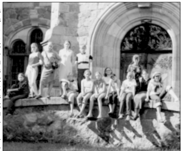
V kurss pie pils ieejas.