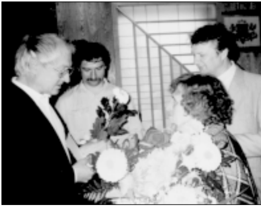
Aizejot pensijā 1995.gada vasarā. Sveic kolēģi.

- Šis tas jāparavē. Jāaprūpē sīklopi. Rokdarbus vairs nestrādāju. Senāk mājās bija stelles, tad arī audu. Ar pašu līniju audām vadmalu, audeklus, no kuriem šu-